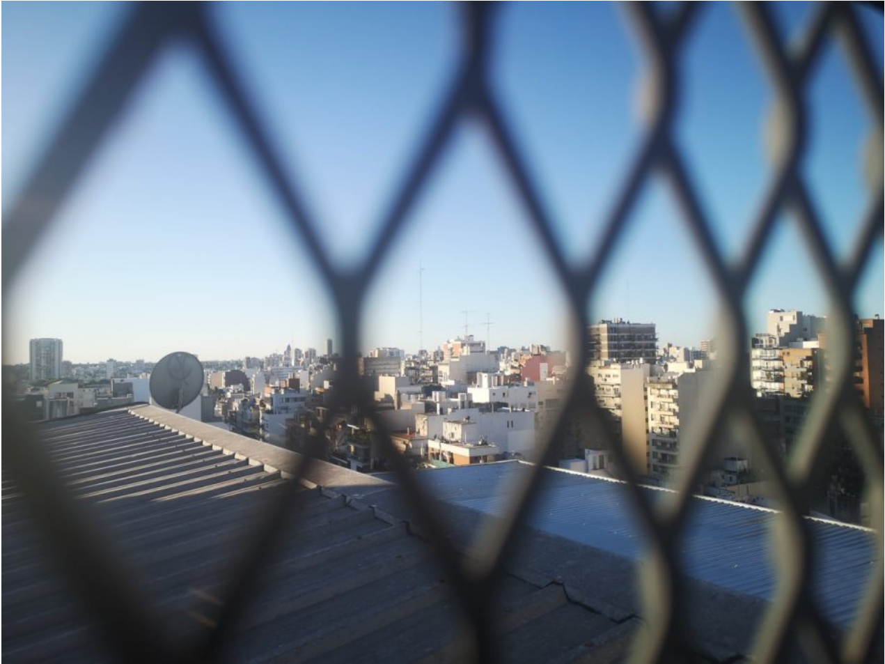
Strikte Quarantäne in Buenos Aires.

Jeden Tag gehen die Menschen um 21 Uhr auf ihre Balkone, um denjenigen zu applaudieren, die in den Krankenhäusern, Supermärkten und Apotheken ihren Beitrag zur Aufrechterhaltung des gesellschaftlichen Funktionierens leisten. Auch am 29. April hörte man wieder Lärm von den Balkonen der Stadt, dieses Mal jedoch keinen Applaus, sondern das scheppernde Schlagen von Löffeln auf Töpfen. In Argentinien nennt man das „cacerolazo“. Der Begriff beschreibt eine Form des Protests, eine Bekundung der Unzufriedenheit, die in der Hauptstadt zwar am lautesten, darüber hinaus jedoch im gesamten Land stattfindet. Grund für diese Proteste ist eine neue Anordnung seitens der Regierung.