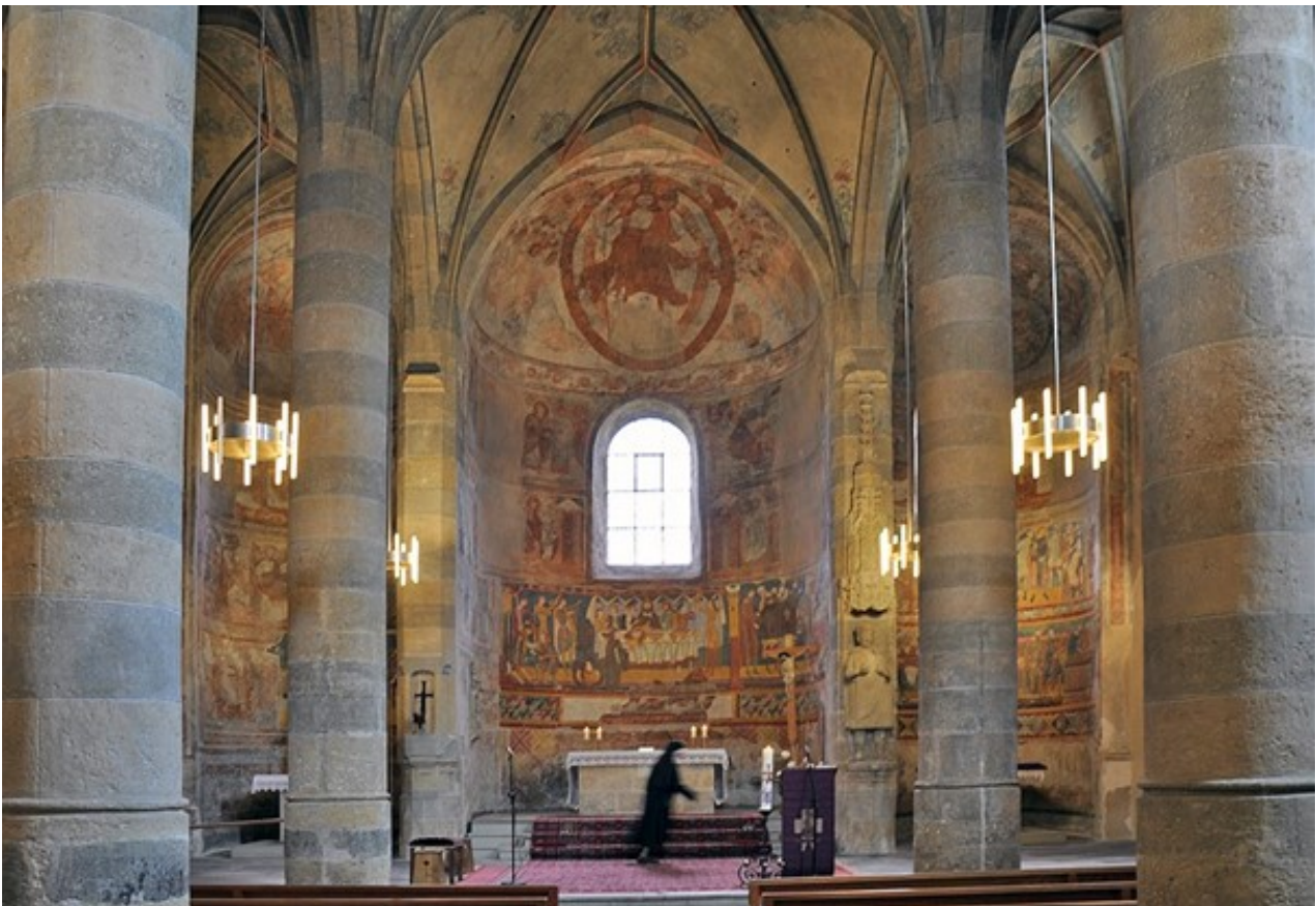
Das Innere der Klosterkirche St. Joseph in Müstair mit den drei Apsiden und der

Durch die symmetrische Aufteilung der Bilder entsteht vom Eingangsportal der Kirche her eine Bewegung auf die gegenüberliegende Schmalseite mit ihren drei Apsiden hin, die optisch durch die Wölbungen der Apsisnischen gekrönt zu werden scheint [2] . Das Kirchenschiff erhält dadurch eine Längsachse und wird zu einem festlichen Prozessionsweg, der an bedeutsamen Etappen der Heilsgeschichte vorbeiführt.