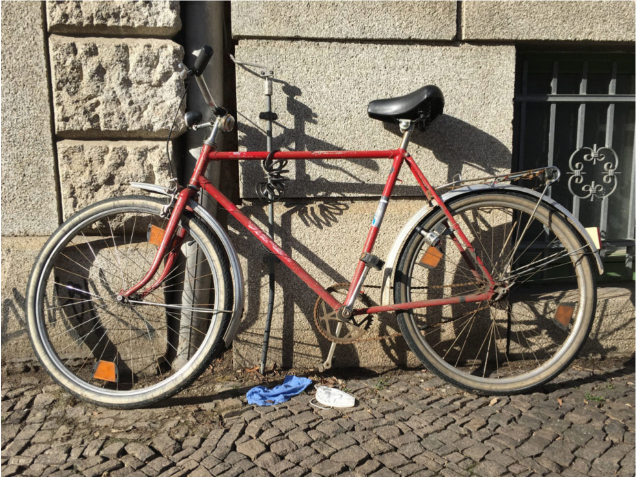
20. Februar 2021 | Leipzig | Lost & Found