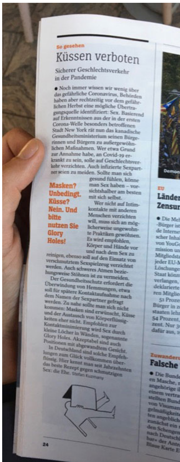
15. September 2020 | Der Spiegel | Sex, Sex, Sex