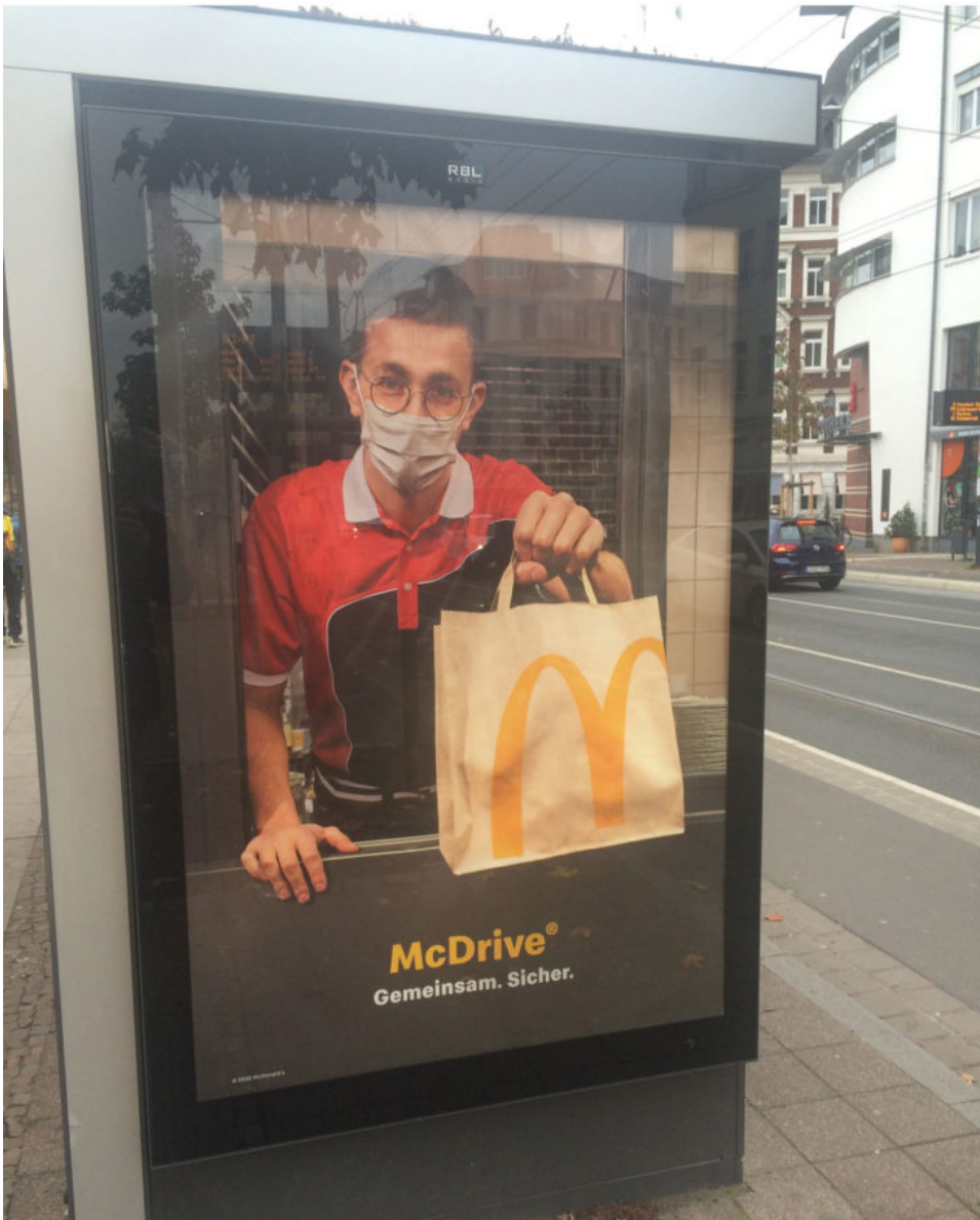
28. November 2020 | Leipzig | Reklame