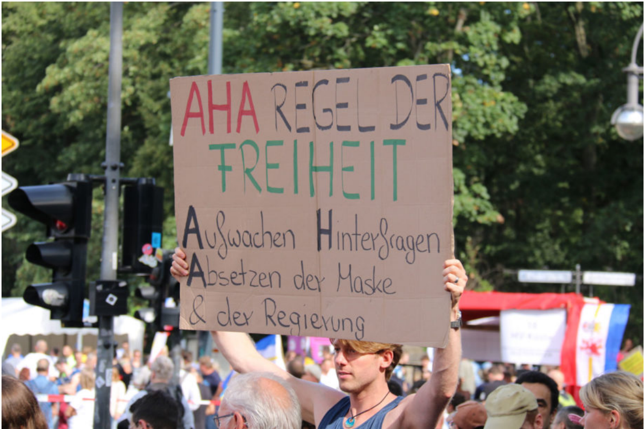
29. August 2020 | Berlin | Freedom's just another word