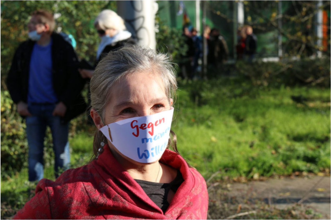
7. November 2020 | Leipzig | Paperwork