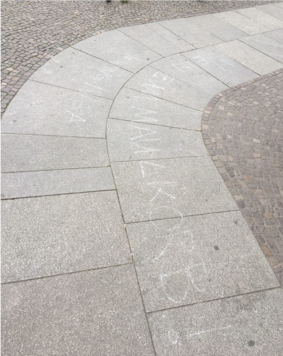
28. April 2020 | Leipzig | Wir haben kein Verständnis.