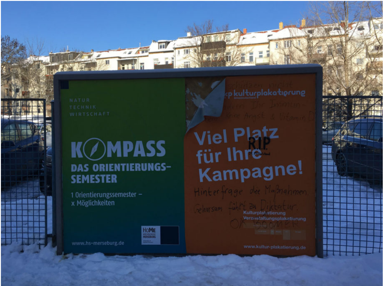
14. Februar 2021 | Leipzig | OK Boomer