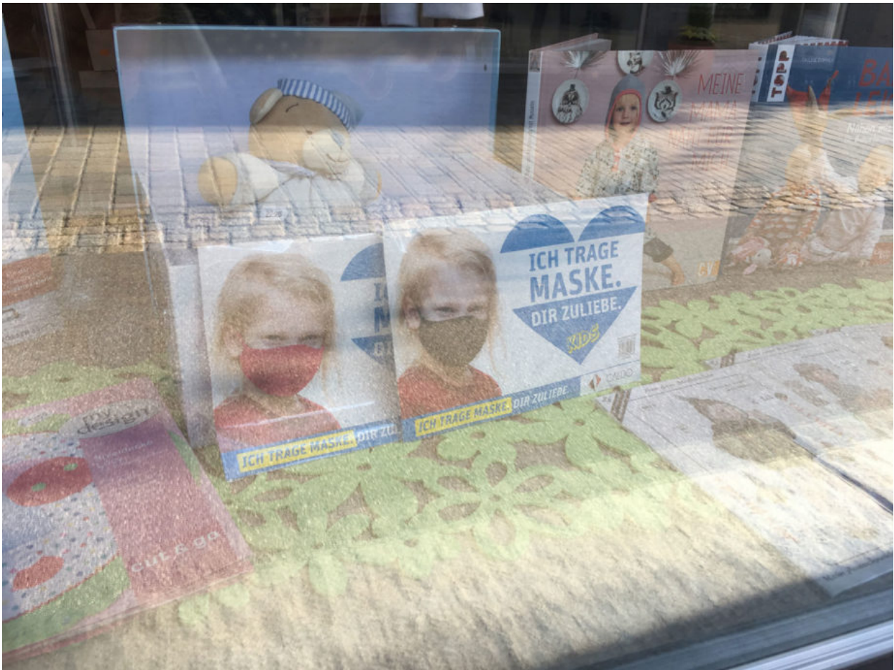
15. September 2020 | Kempten | Dir zuliebe