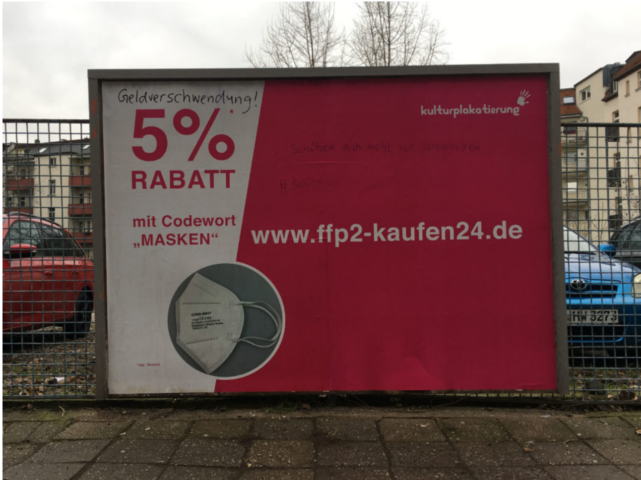
2. Februar 2020 | Leipzig | Schützen auch nicht vor Coronaviren