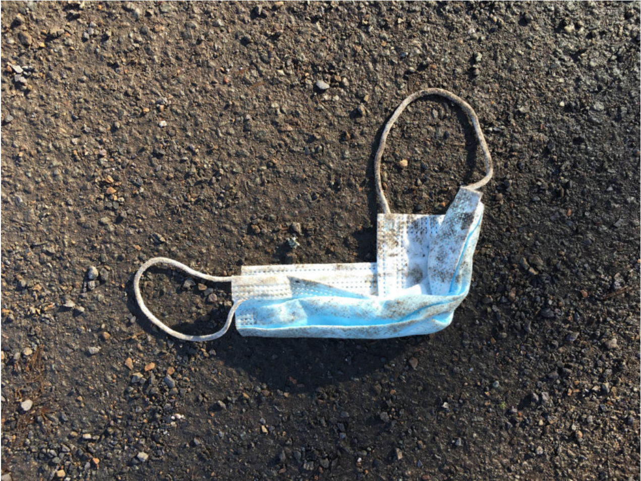
21. Februar 2021 | Leipzig | Lost & Found