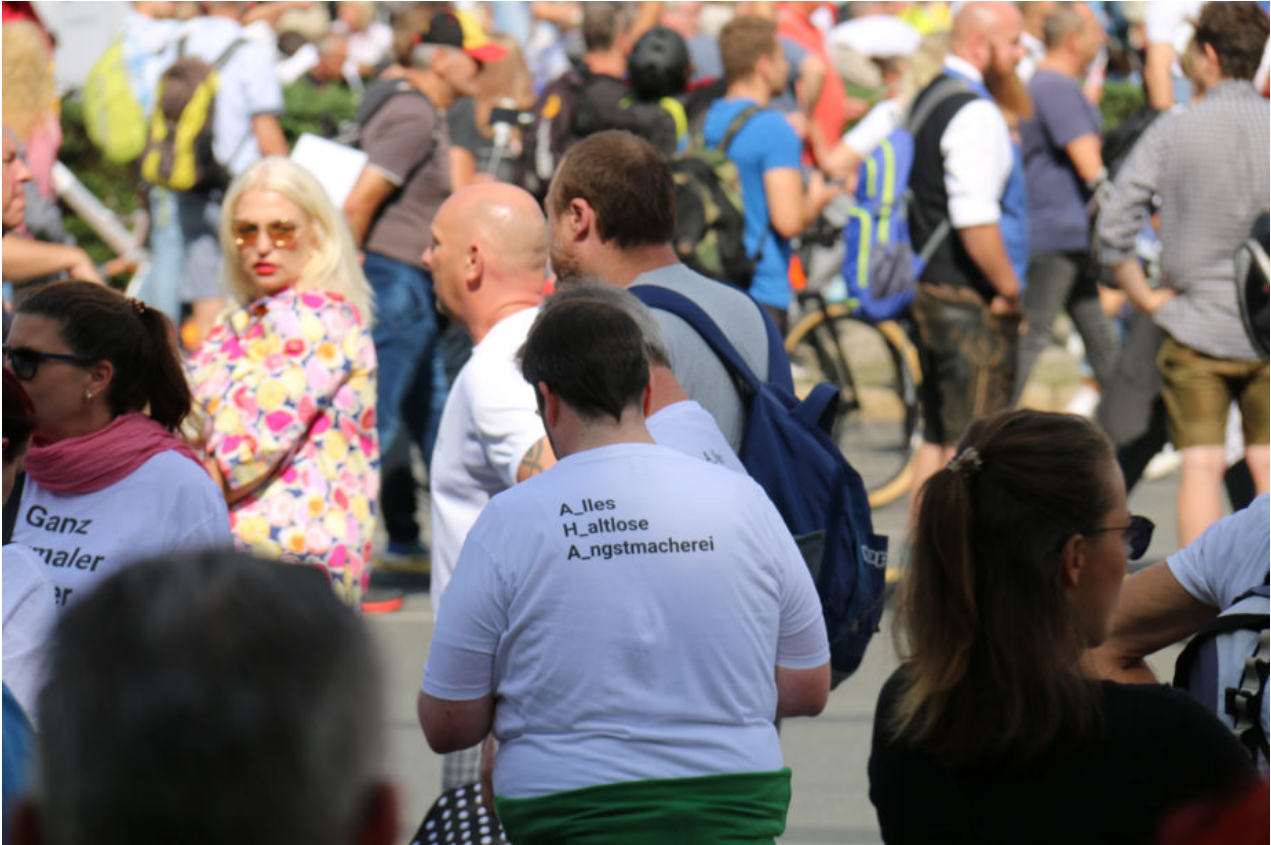
29. August 2020 | Berlin | Aha