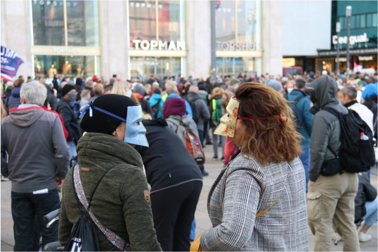
10. Oktober 2020 | Berlin | Blicke I