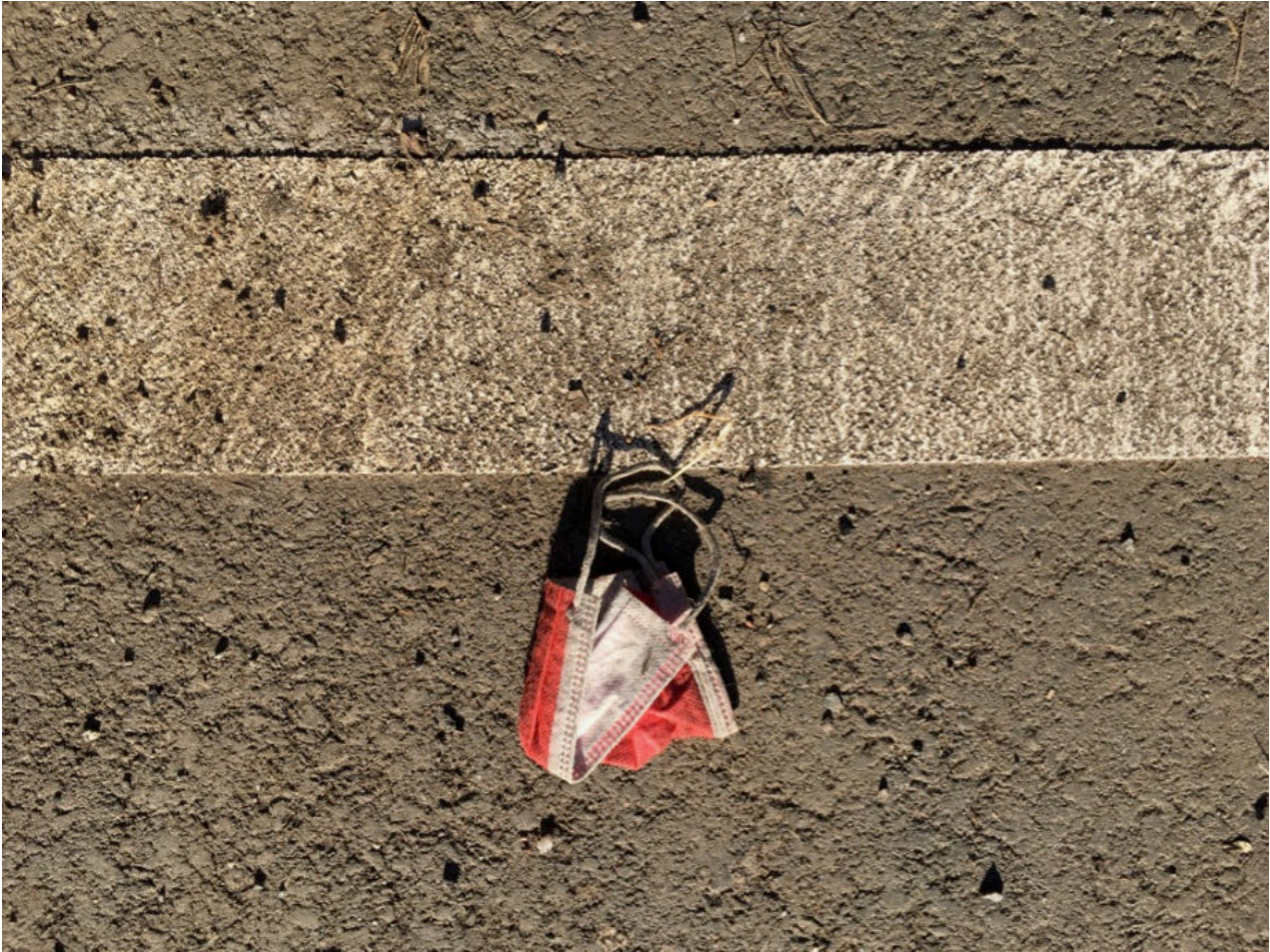
23. Februar 2021 | Leipzig | Lost &