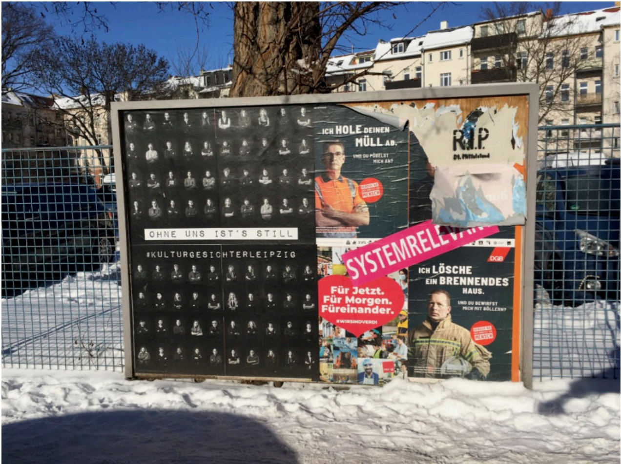
14. Februar 2021 | Leipzig | Kultur und Systemrelevanz