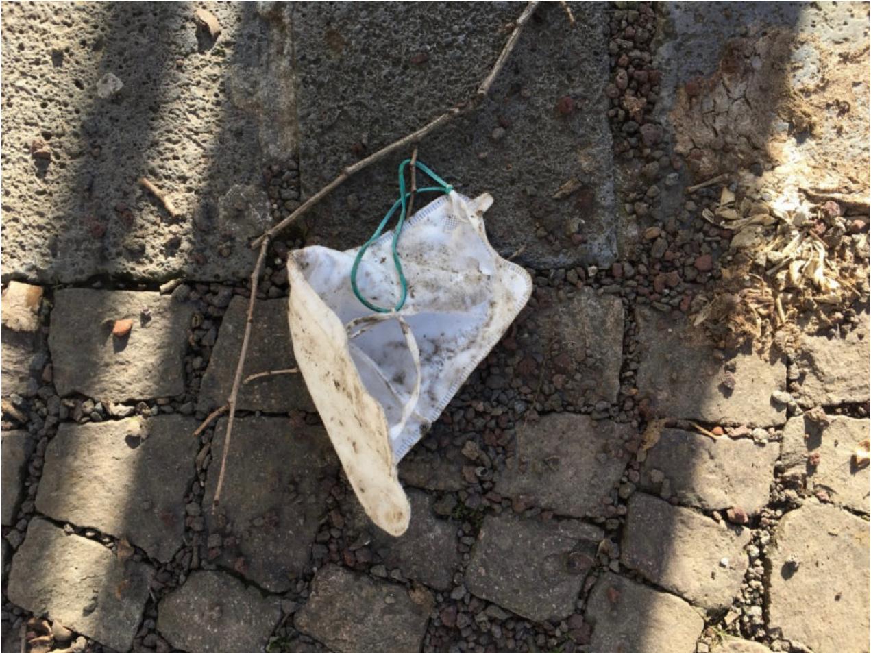
22. Februar 2021 | Leipzig | Lost & Found