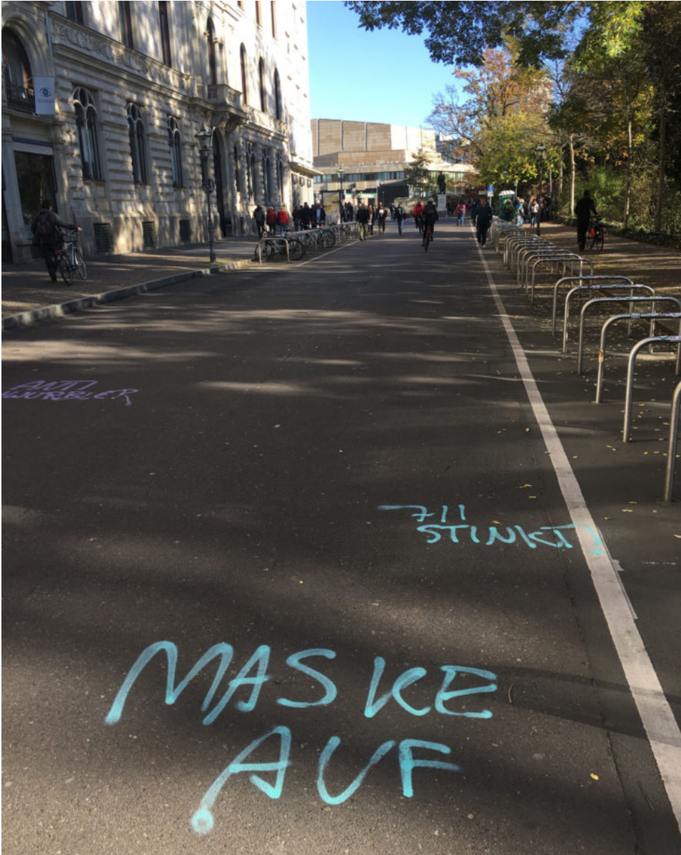
7. November 2020 | Leipzig | Antischwurbler