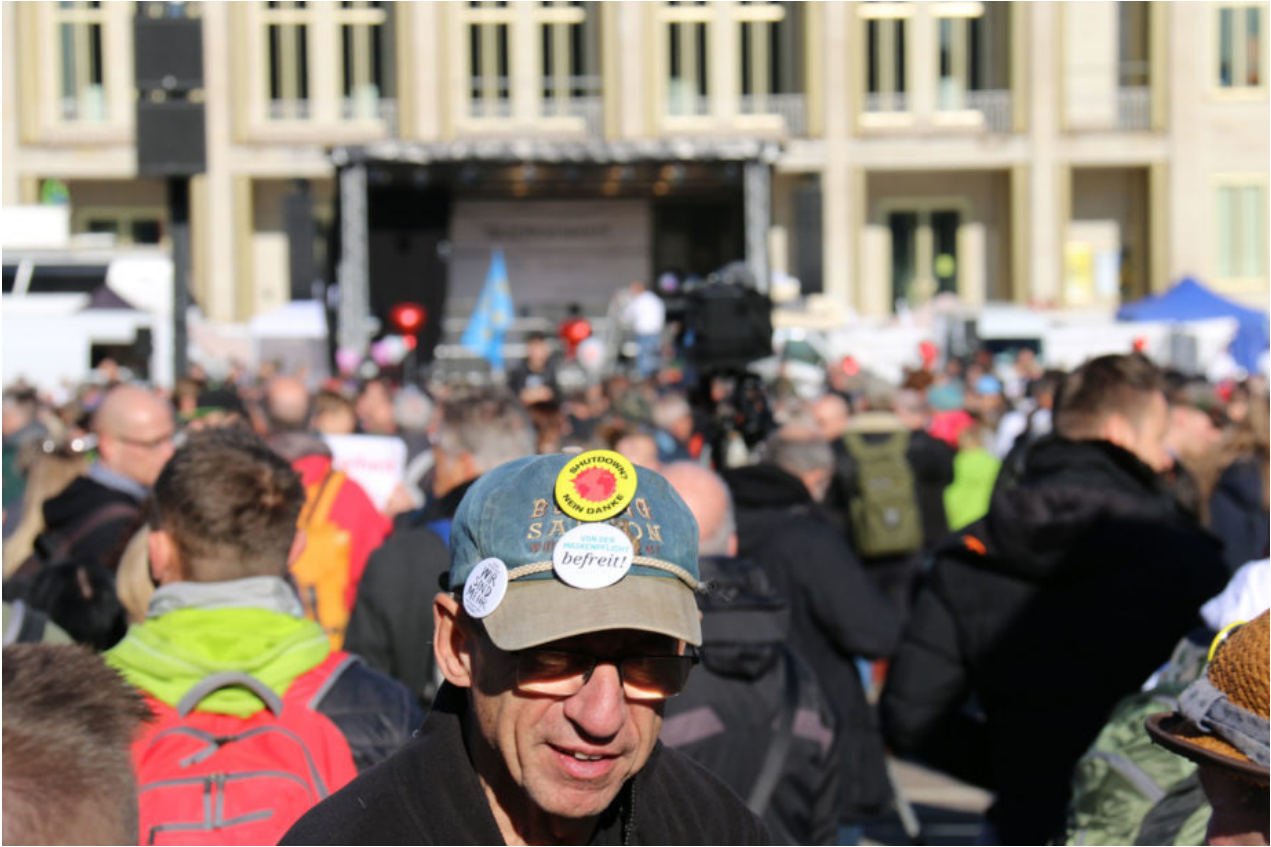
7. November 2020 | Leipzig | Antimaske