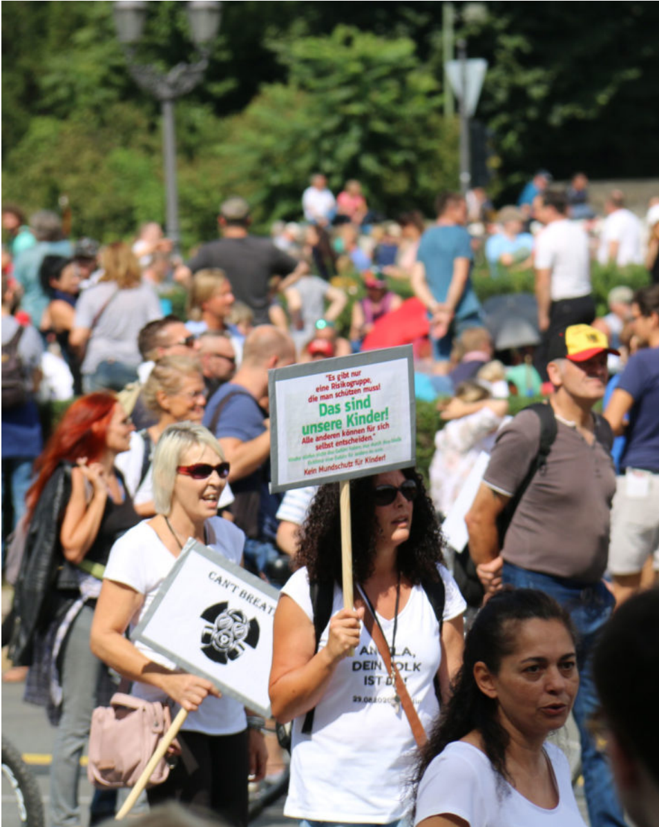
29. August 2020 | Berlin | Angela, Dein Volk ist da!