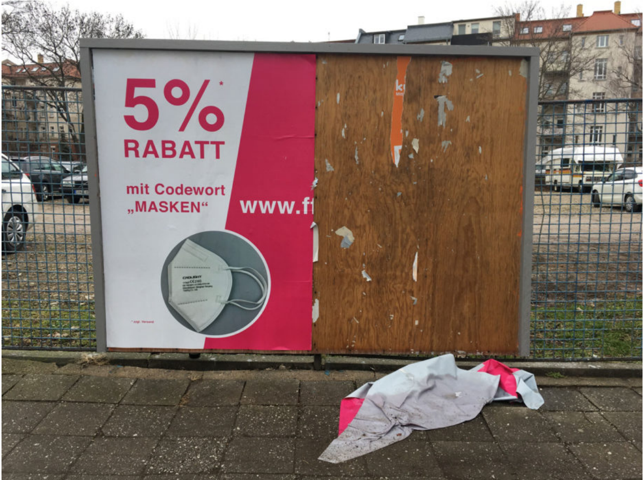
2. Februar 2021 | Leipzig | Codewort