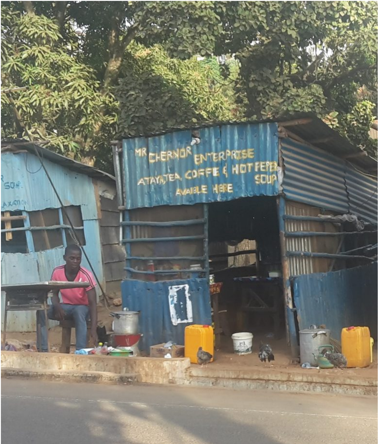
Chernors Shop (in der Mitte) in etwas besseren Zeiten im Februar 2017