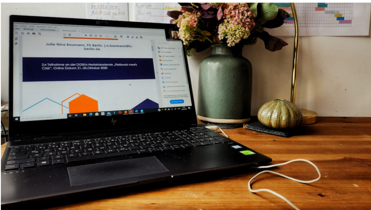
Das „Home Office“ der Autorin, Foto: JB privat.

Während sich immer mehr Menschen in das Zoom-Meeting einloggen werden die Anzeigebilder immer kleiner. Bald muss ich mehrfach scrollen um einen Überblick über die über sechzig Teilnehmer*innen zu bekommen. In den winzigen Bildern erkenne ich bei Manchen Ausschnitte aus ihren Privatwohnungen: Ich sehe Familienfotos an den Wänden, Haustiere durchs Bild laufen, bei einer Teilnehmerin hält ein Baby immer wieder seine Fäustchen in die Kamera. Auch ich habe vorher getestet, wo ich mich mit meinem Laptop hinsetze. Wie viel Einblick in meine Privaträume möchte ich geben? Irgendwann gebe ich auf – die Auswahl ist in meinem Zimmer doch