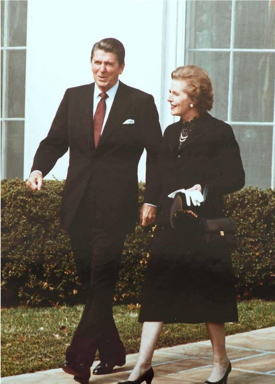
Margaret Thatcher und Ronald Reagan: Die Architekten des TINA-Prinzips

Thatcher erhoffte sich vom TINA-Prinzip wohl durchaus auch performative Wirkung – Alternativen im Sinne politischer Handlungsoptionen waren damals noch präsenter. In den kommenden Jahrzehnten gestaltete sich die Situation zunehmend einseitiger. Die sogenannte freie Marktwirtschaft setzte sich global durch, TINA