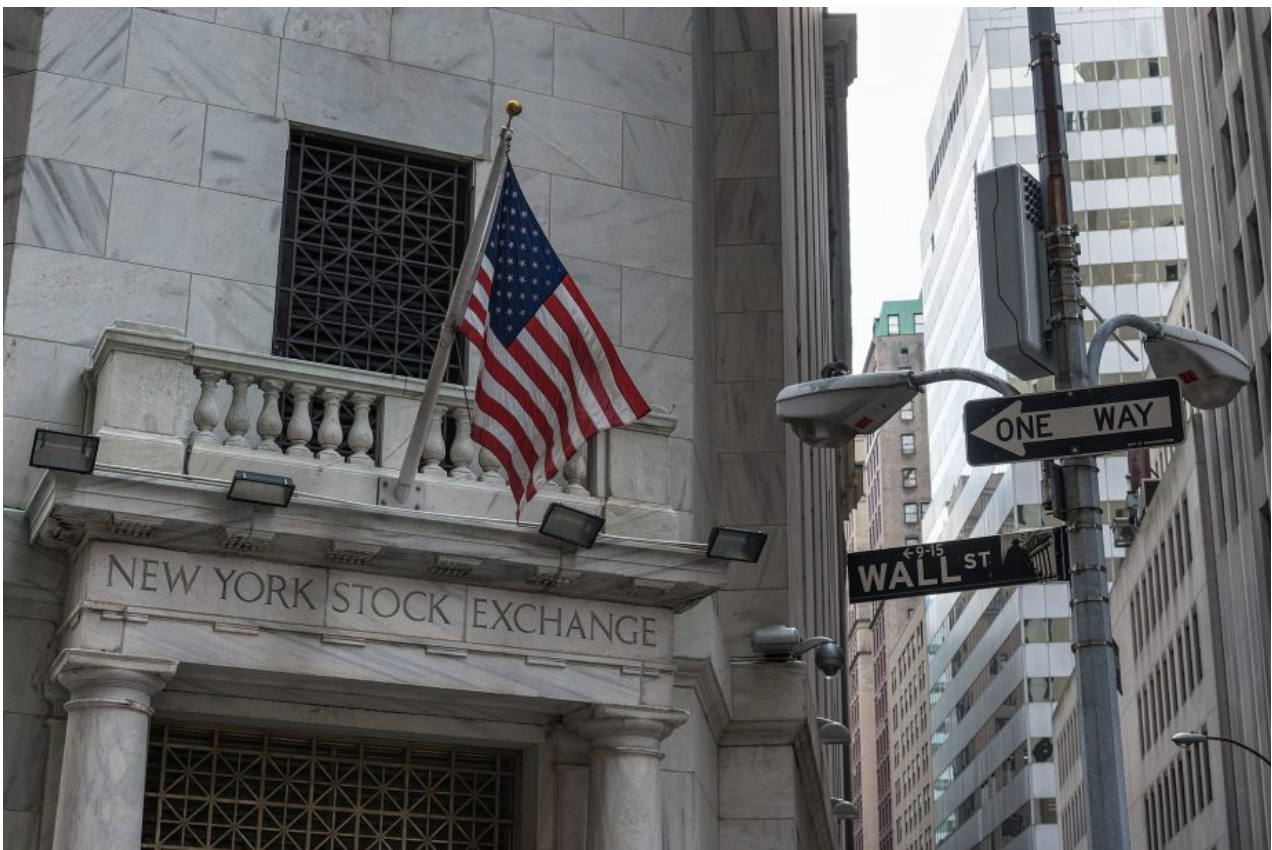
Die Wall Street: Auch dieser Ort funktioniert nicht frei von Kultur und sozialen Konventionen

ethnographische Blick auf die «Hochburgen des Kapitalismus» verrät Interessantes. So konnte Caitlin Zaloom (2006) in ihrer Forschung zu Börsenhändler*innen in Chicago und London zeigen, wie selbst im heute hochtechnologisierten Börsenhandel stets ein fiktives Gegenüber imaginiert wird, welchem ein bestimmtes Ethos zugeschrieben wird. Der Handel mit Wertpapieren, so Zaloom, basiert auf verinnerlichten Normen, Handlungsstrategien und damit auf kulturellen Bedeutungssystemen. Ähnliches lehrt uns die Forschung von Karen Ho (2009). Ho gibt in ihrem Buch Liquidated: An Ethnography of Wall Street einen Einblick in die Rekrutierungsnetzwerke der Wall Street und zeigt, dass diese entgegen der Behauptung der Banker*innen keineswegs meritokratisch organisiert sind, sondern stark auf Herkunft und Habitus basieren.