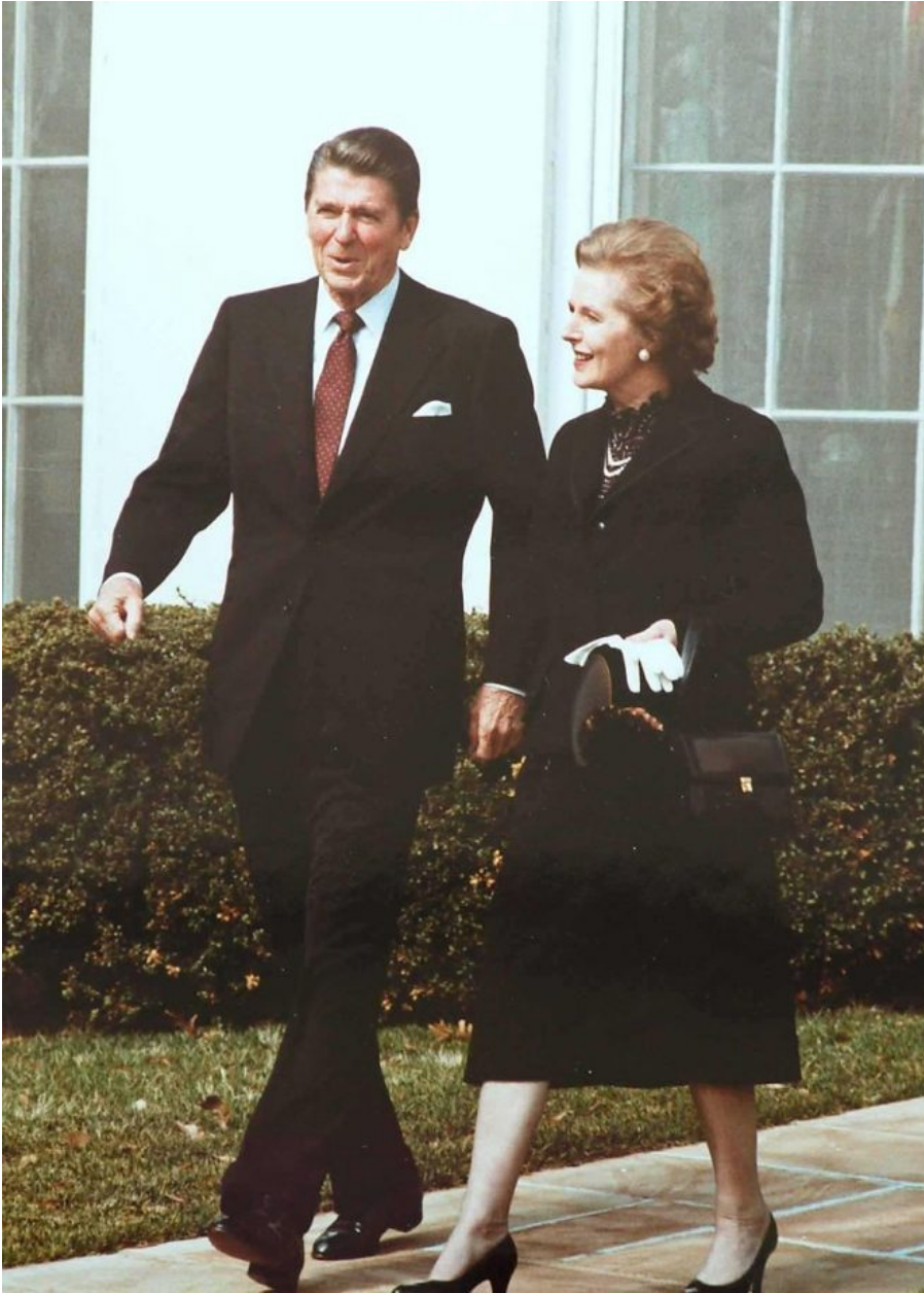
Margaret Thatcher und Ronald Reagan: Die Architekten des TINA-Prinzips

Thatcher erhoffte sich vom TINA-Prinzip wohl durchaus auch performative Wirkung – Alternativen im Sinne politischer Handlungsoptionen waren damals noch präsenter. In den kommenden Jahrzehnten gestaltete sich die Situation zunehmend einseitiger. Die sogenannte freie Marktwirtschaft setzte sich global durch, TINA