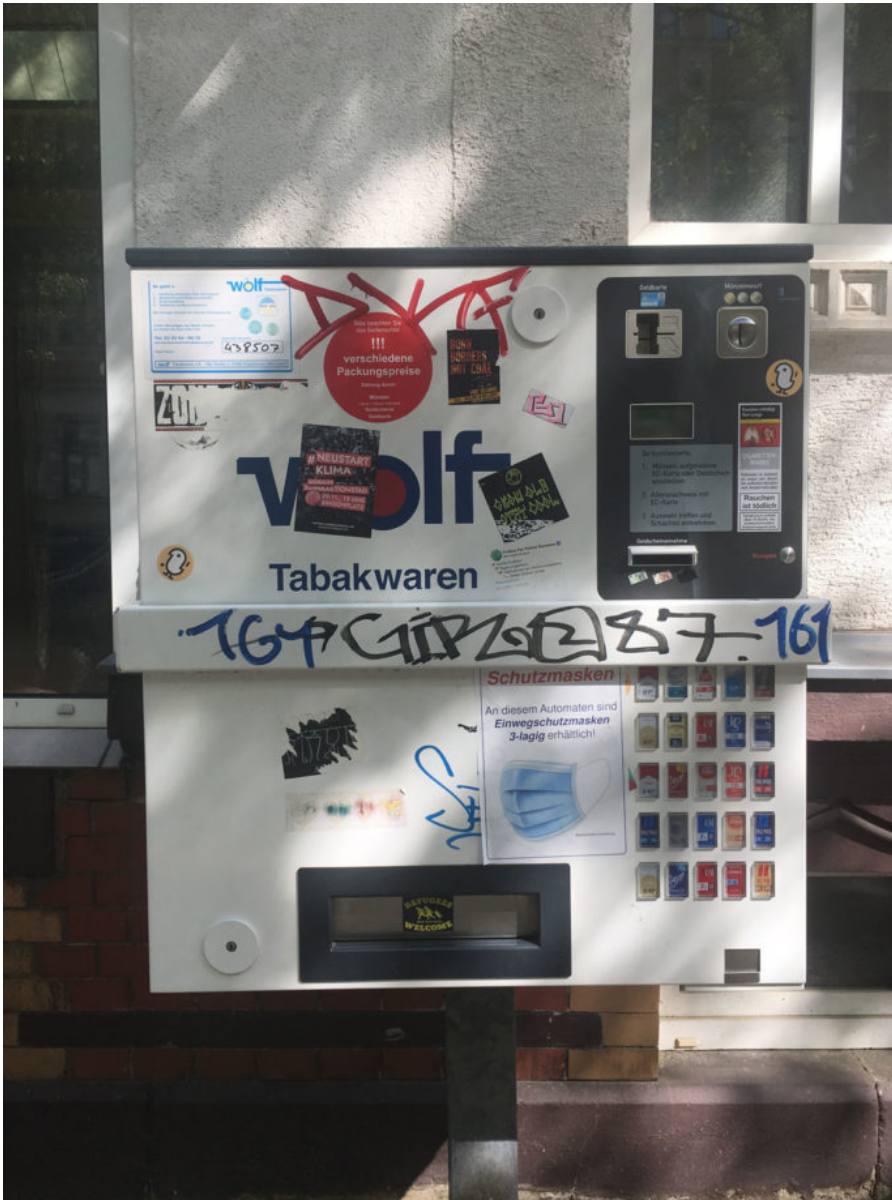
16. Mai 2020 | Leipzig | Luckies