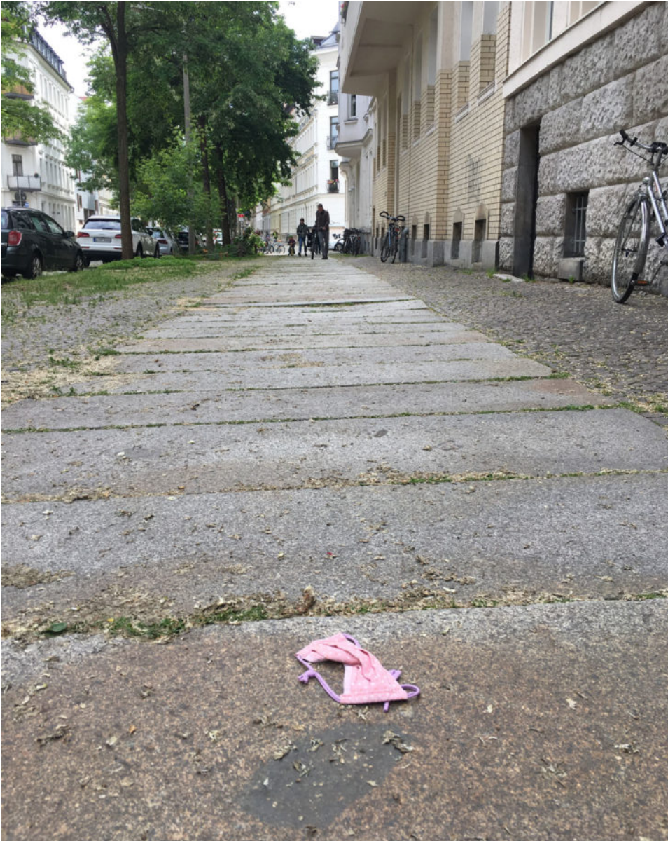
5. Juni 2020 | Leipzig | Lost & Found