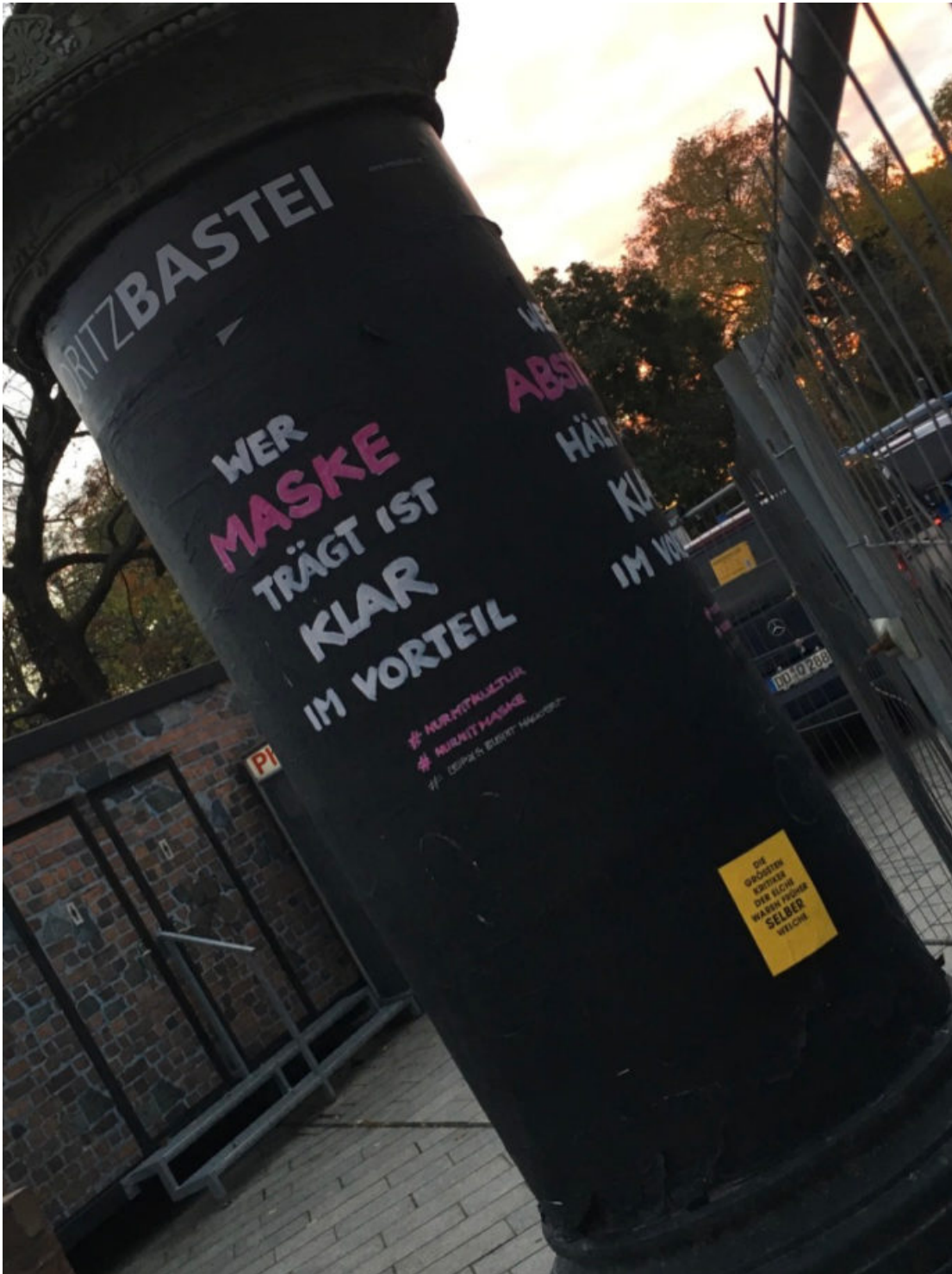
21. November 2021 | Leipzig | Die größten Kritiker der Elche