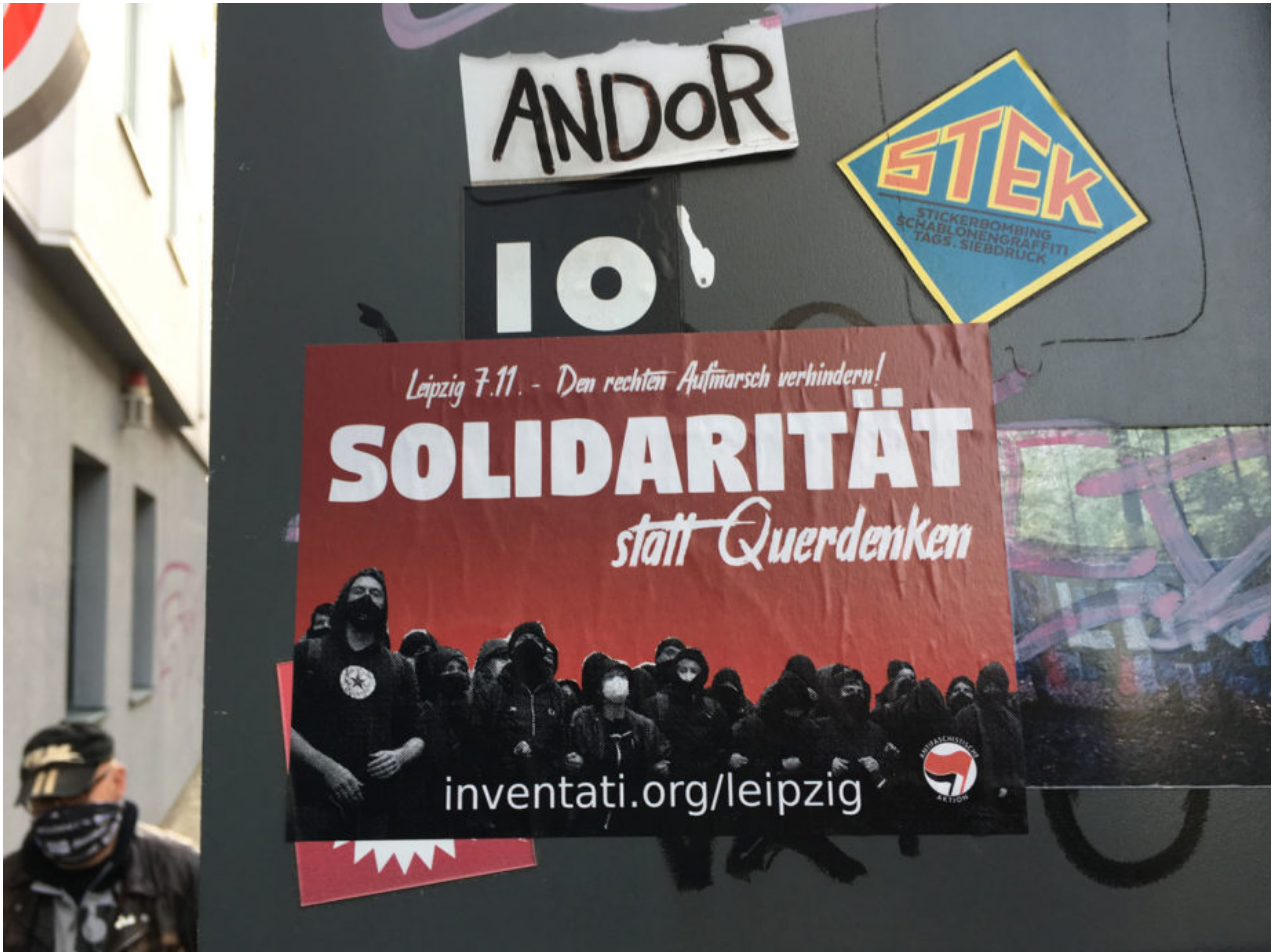
6. November 2020 | Leipzig | Aufruf II