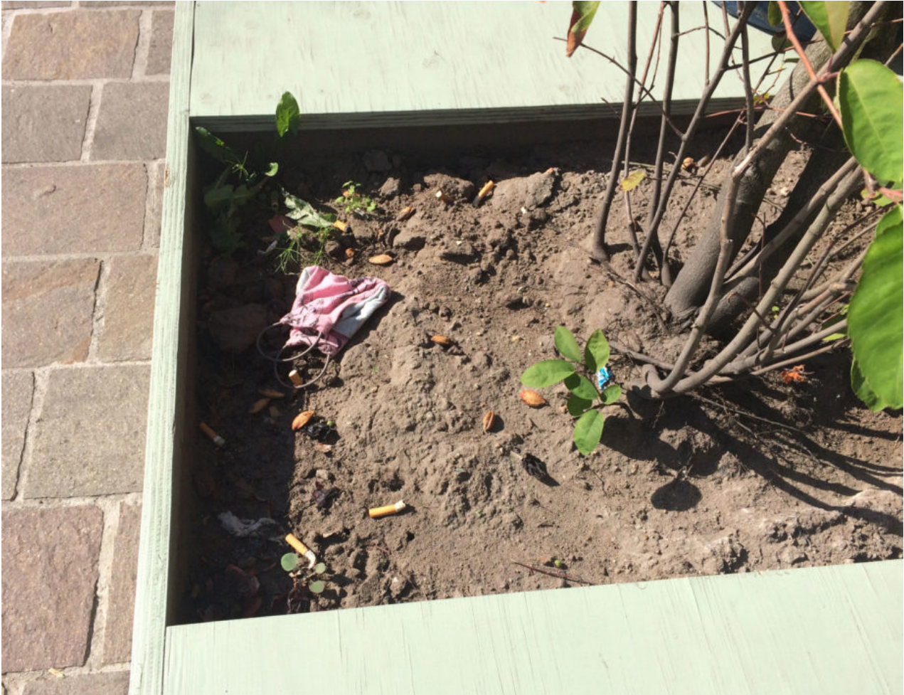
24. September 2020 | Bremen | Lost & Found