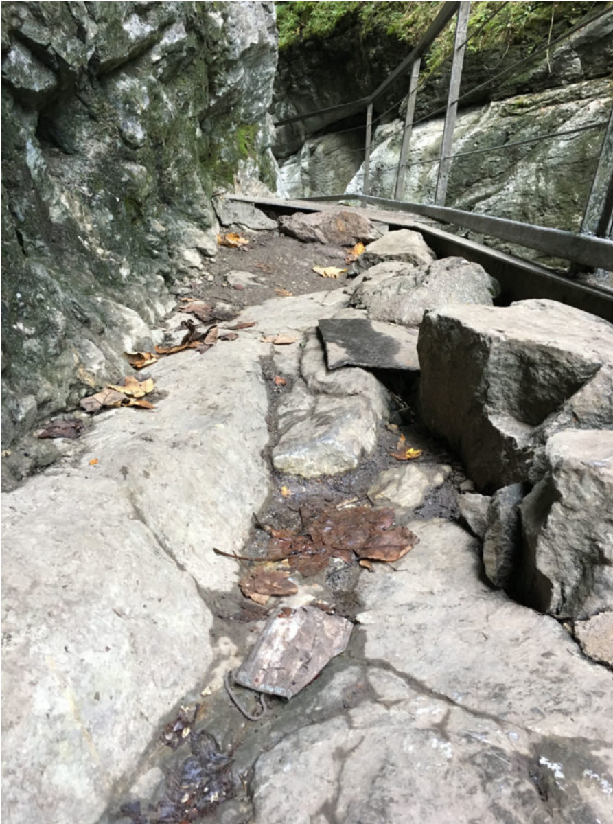
19. September 2020 | Starzlachklamm | Lost & Found