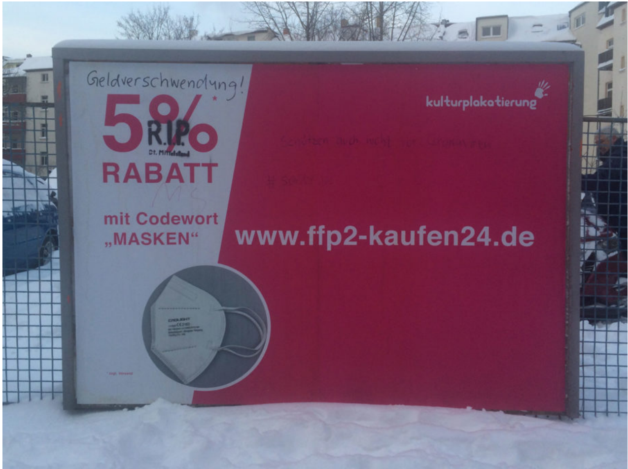
8. Februar 2021 | Leipzig | R.I.P Dt. Mittelstand II