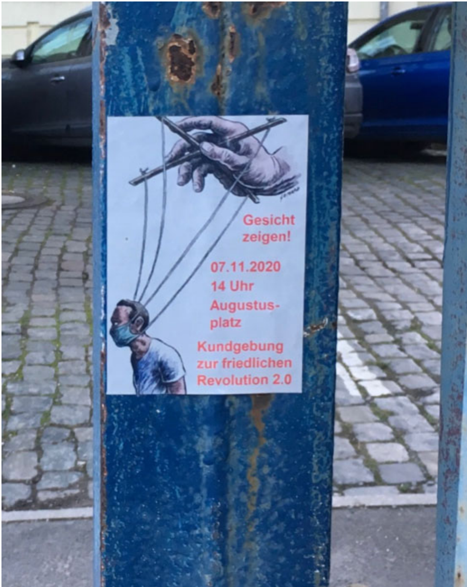
6. November 2020 | Leipzig | Aufruf I