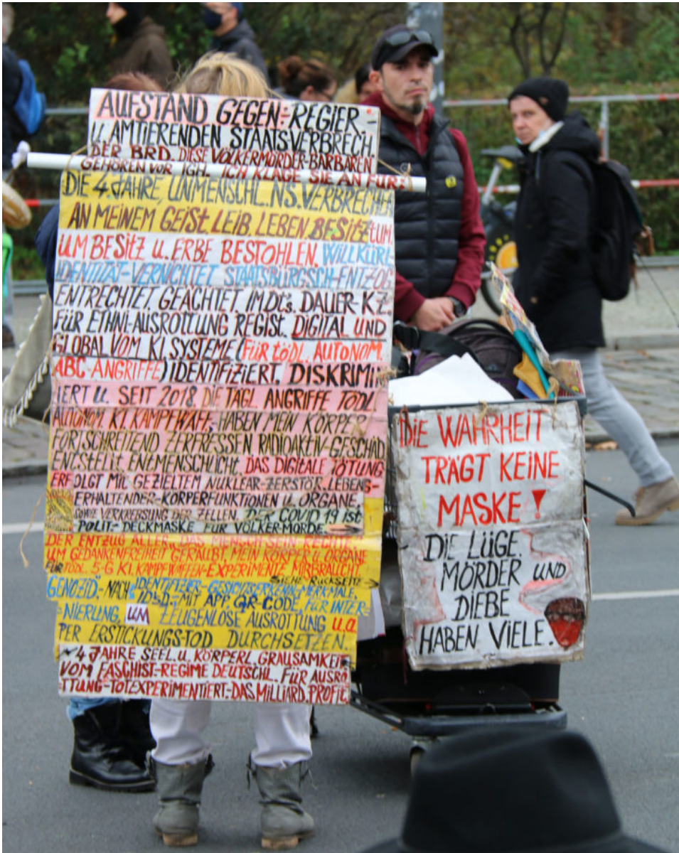
18. November 2020 | Berlin | Die Wahrheit