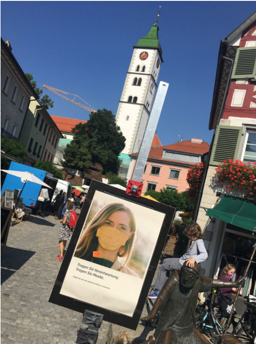
12. September 2020 | Wangen im Allgäu | Träger*innen