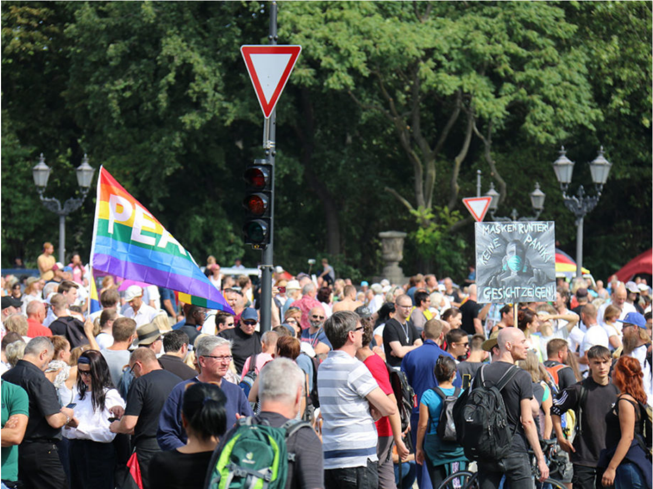
29. August 2020 | Berlin | Masse und Maske