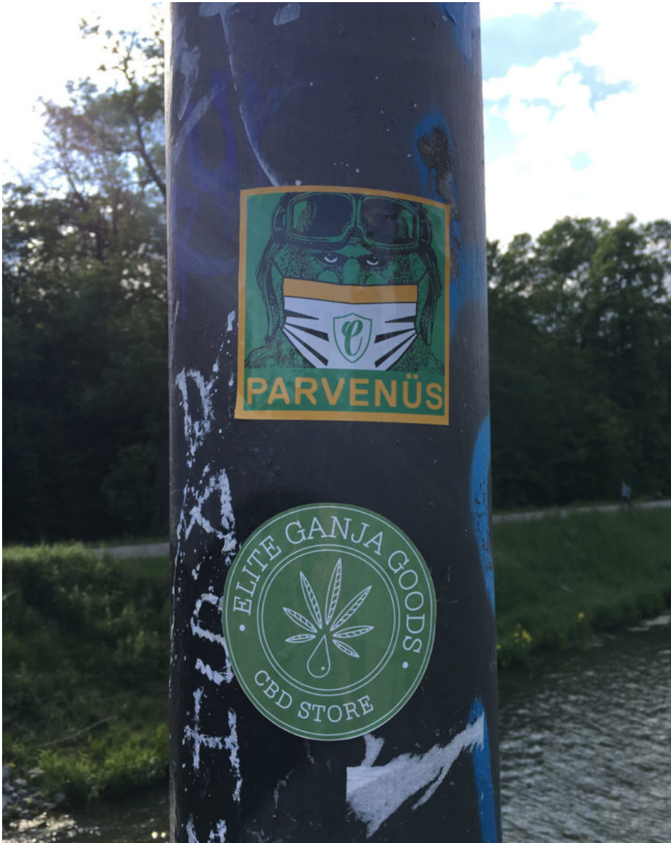
Leipzig | 26. Mai 2020 | Elites