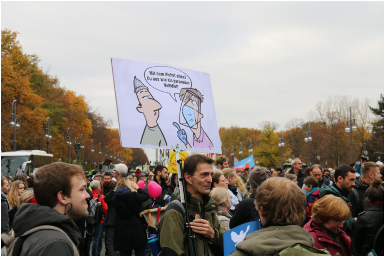
18. November 2020 | Berlin | Paranoia