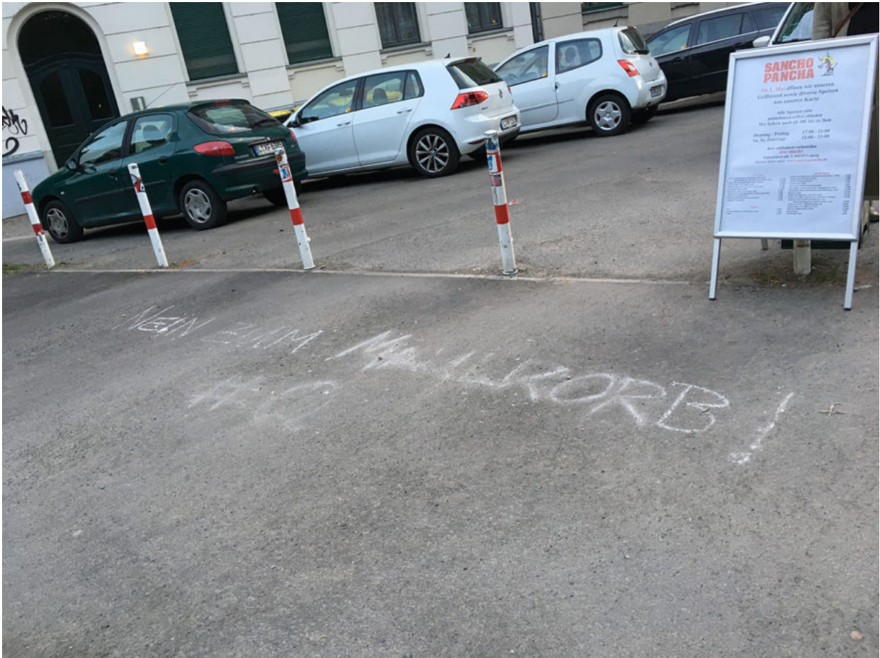
15. Mai 2020 | Leipzig | Where we go 1 we go all.