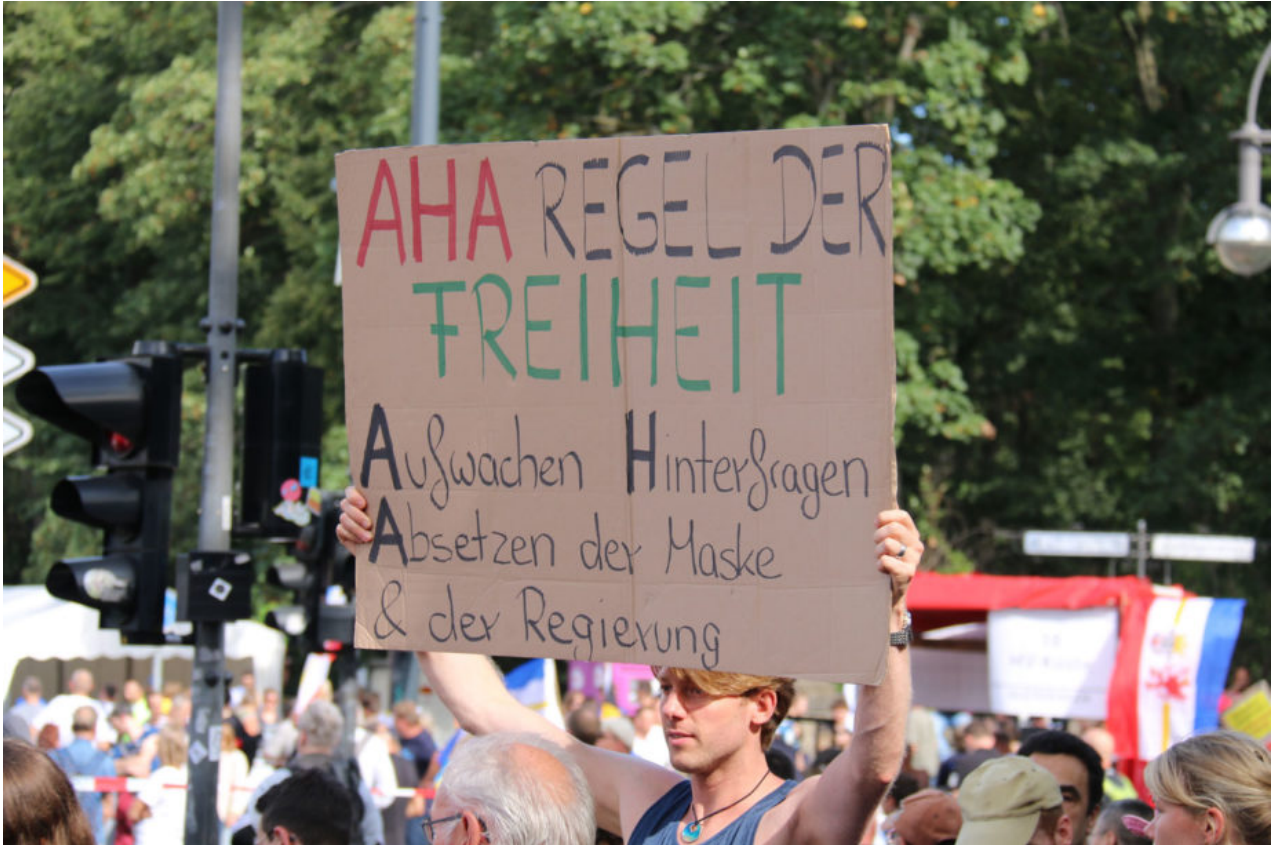
29. August 2020 | Berlin | Freedom's just another word