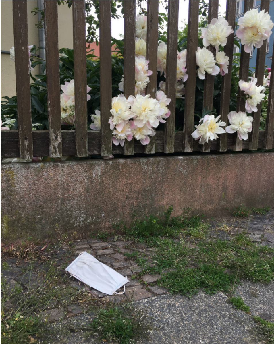
8. Juni 2020 | Leipzig | Lost & Found