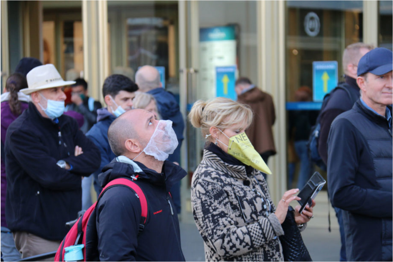
10. Oktober 2020 | Berlin | Blicke II