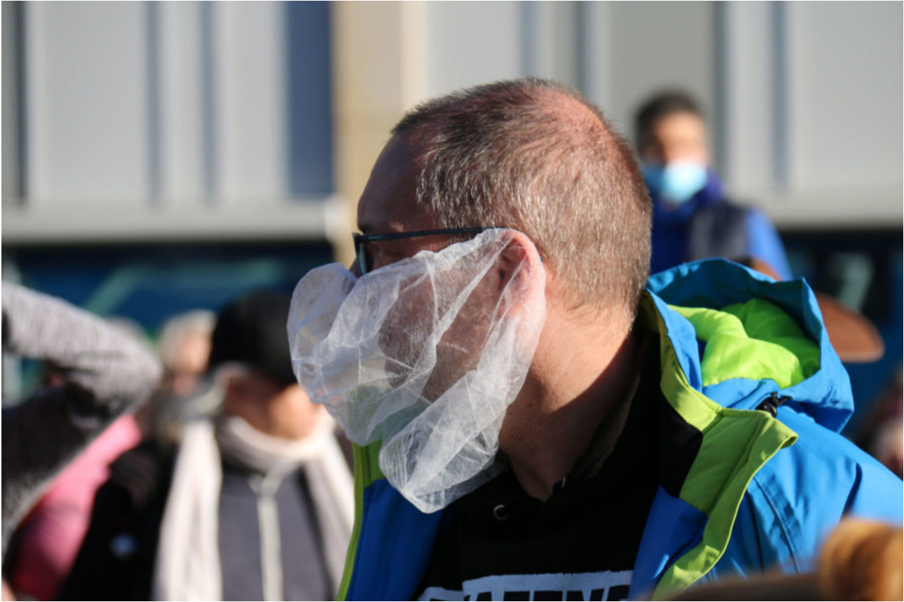
7. November 2020 | Leipzig | Ghostbusters