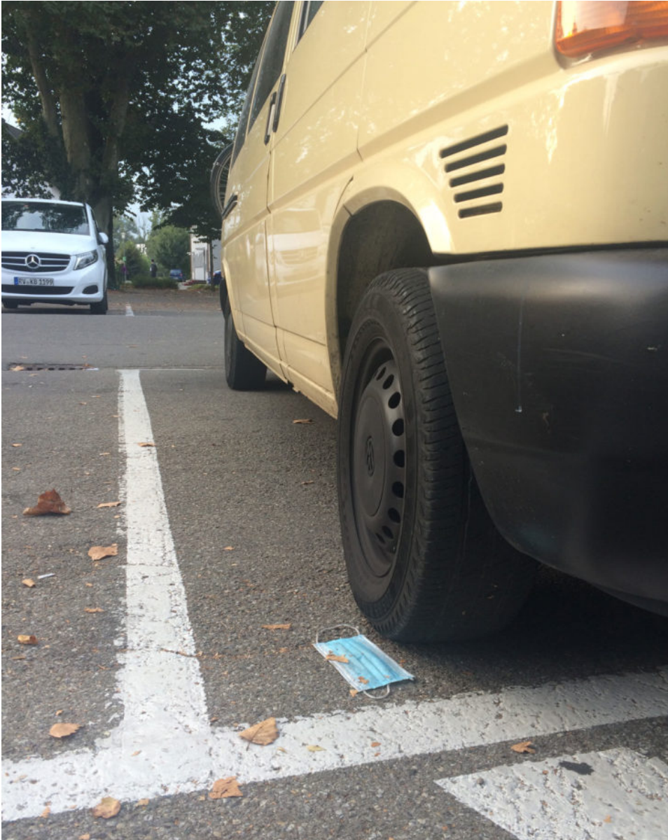
21. September 2021 | Wangen im Allgäu | Lost & Found