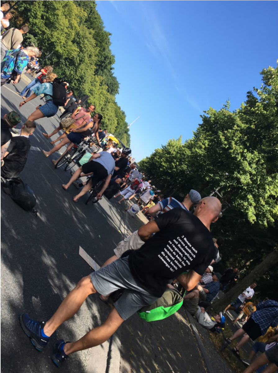
1. August 2020 | Berlin | Logisch