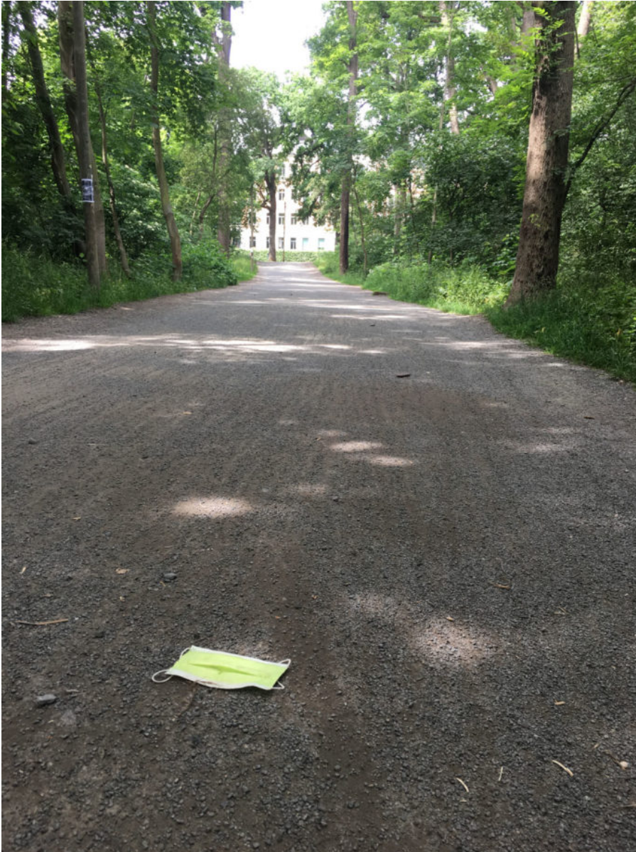
10. Juni 2020 | Leipzig | Lost & Found