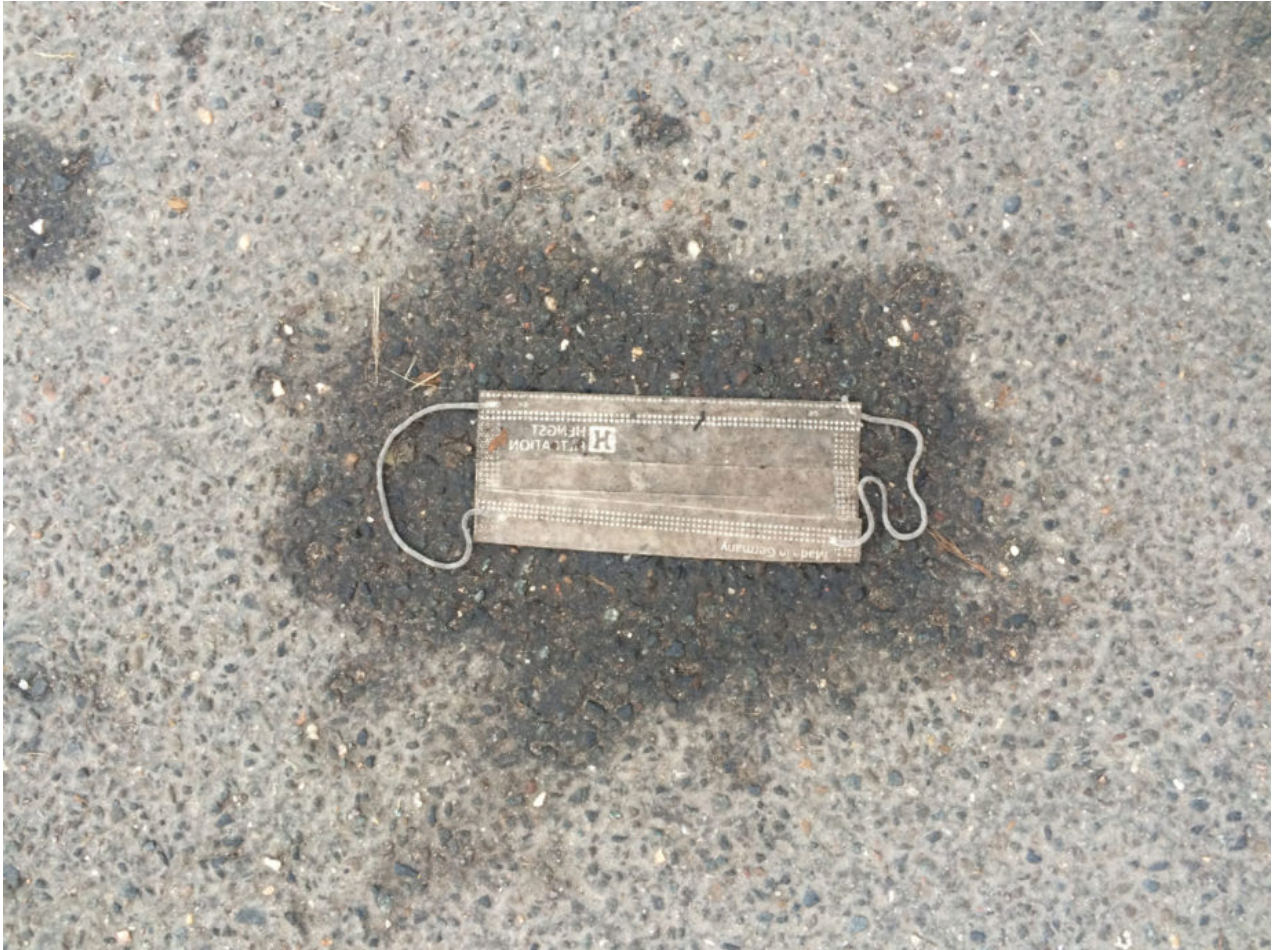
13. Dezember 2020 | Leipzig | Lost & Found