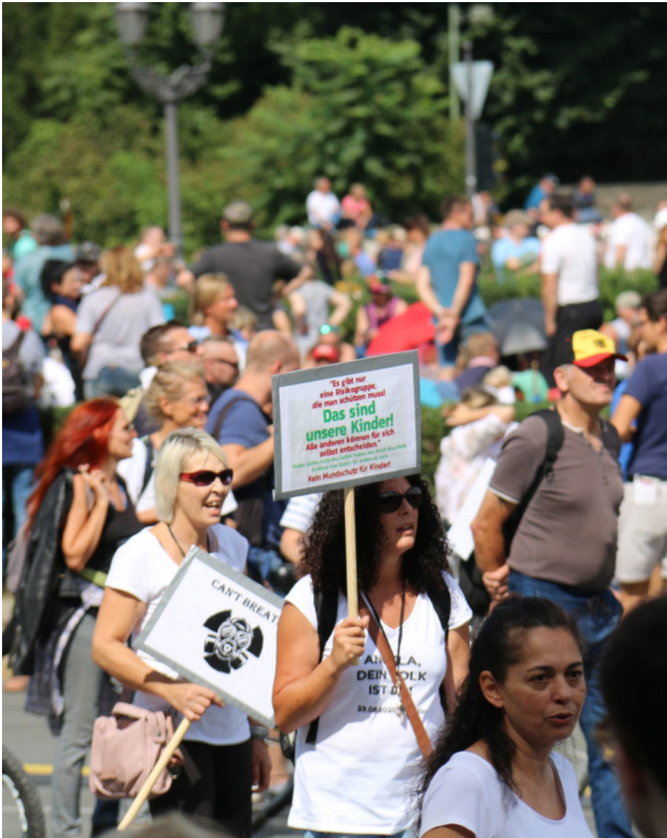
29. August 2020 | Berlin | Angela, Dein Volk ist da!