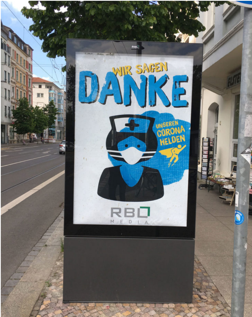
15. Mai 2020 | Leipzig | Corona-Helden