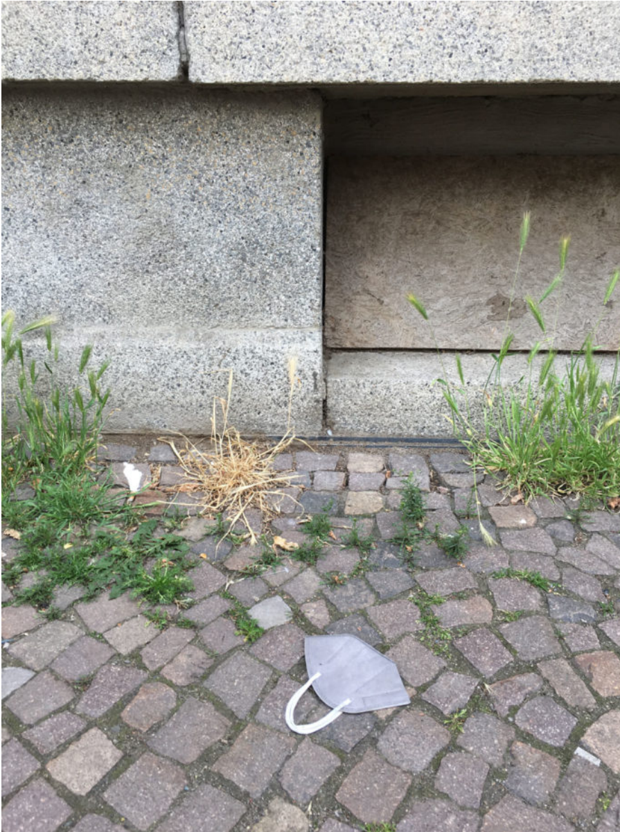
8. Juni 2020 | Leipzig | Lost & Found