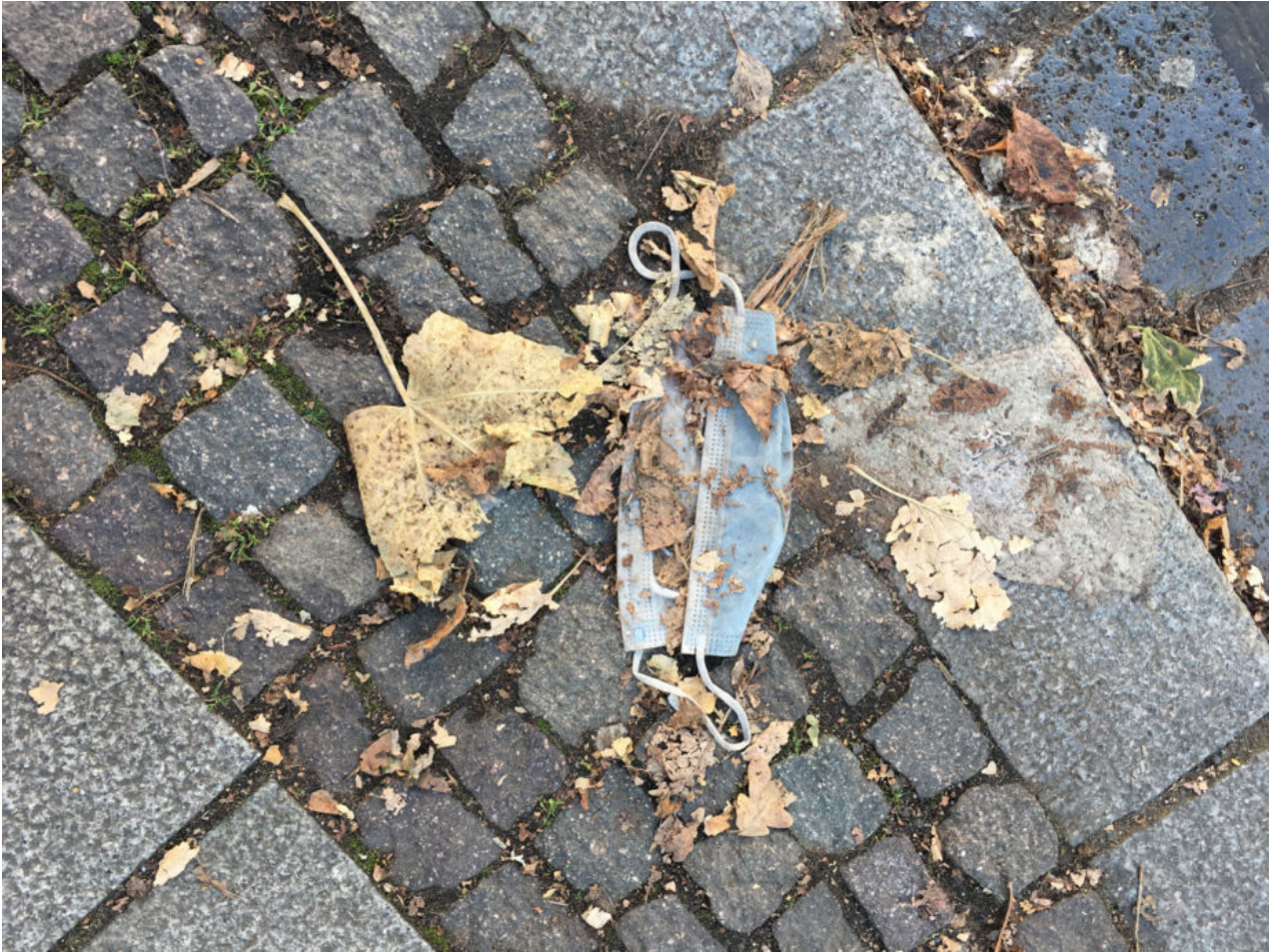
6. November 2020 | Leipzig | Lost & Found