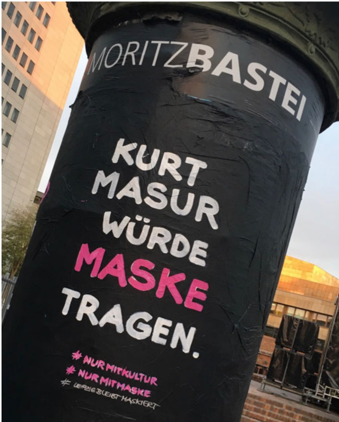
21. November 2020 | Leipzig | #Leipzigbleibtmaskiert