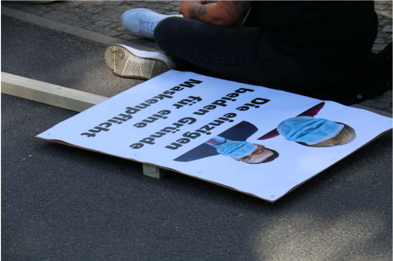
29. August 2020 | Berlin | Die einzigen beiden