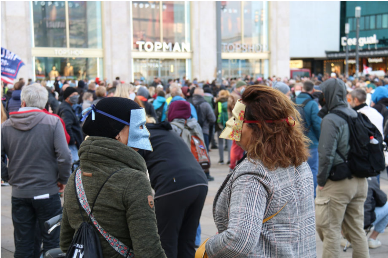
10. Oktober 2020 | Berlin | Blicke I