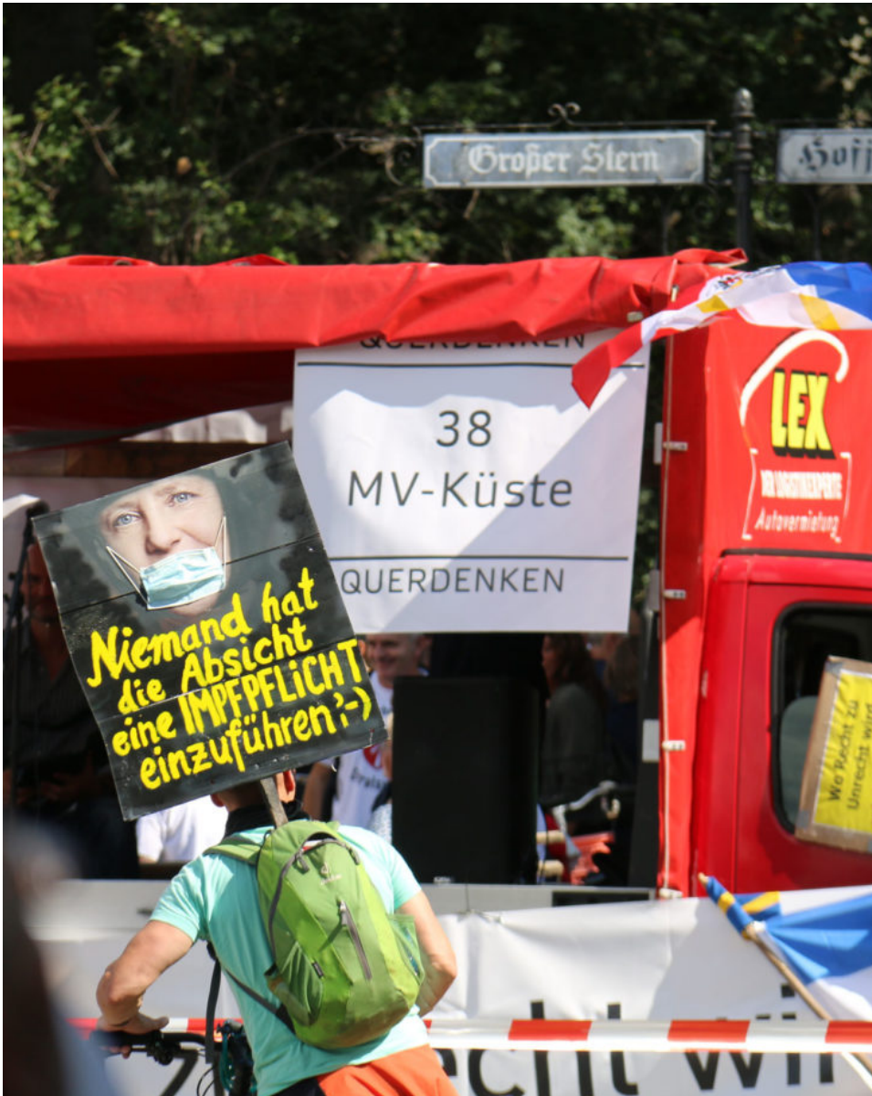
29. August 2020 | Berlin | Prophezeiung I