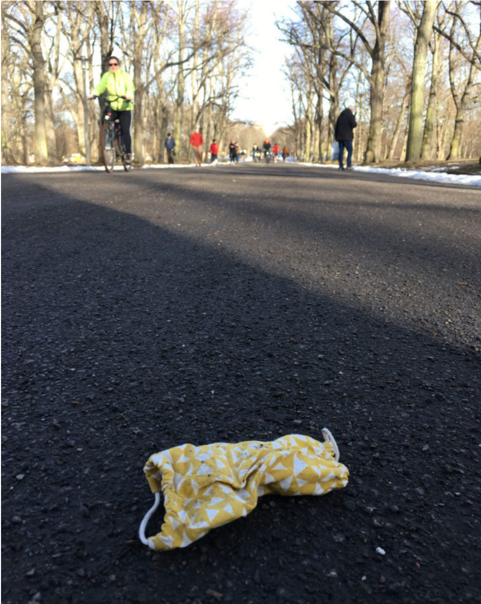
19. Februar 2021 | Leipzig | Lost & Found