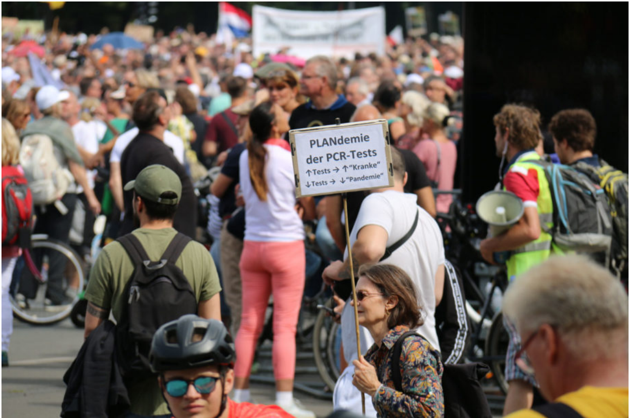
29. August 2020 | Berlin | PCRdemie