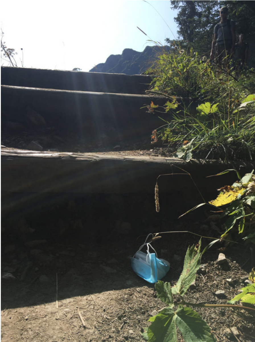
18. September 2020 | Allgäu | Lost & Found