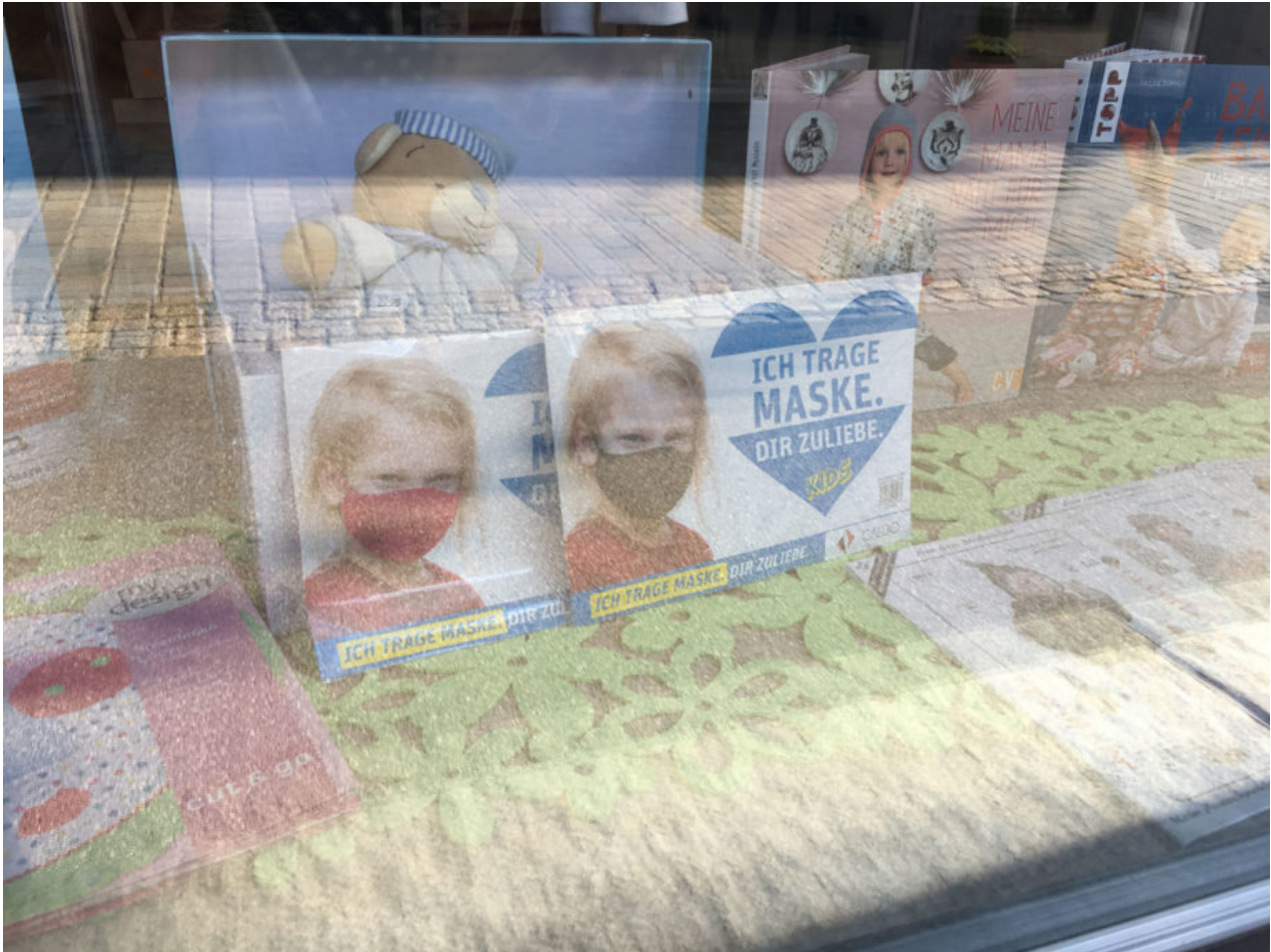
15. September 2020 | Kempten | Dir zuliebe