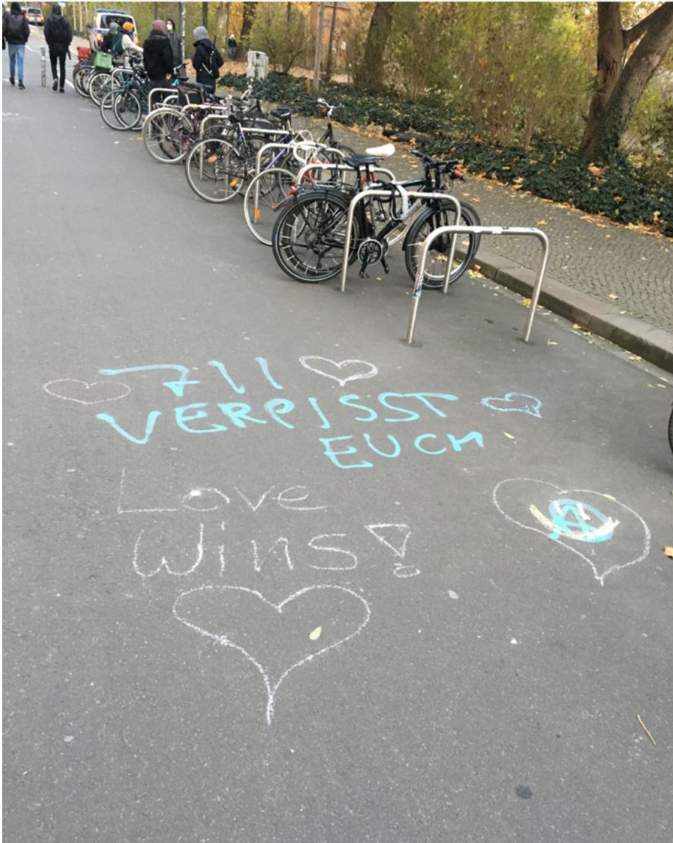
21. November 2021 | Leipzig | Anti-Antischwurbler