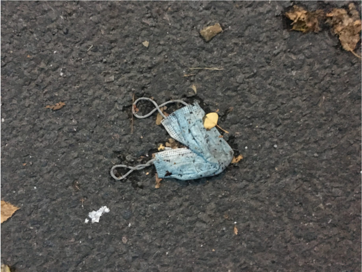
29. Oktober 2020 | Leipzig | Lost & Found