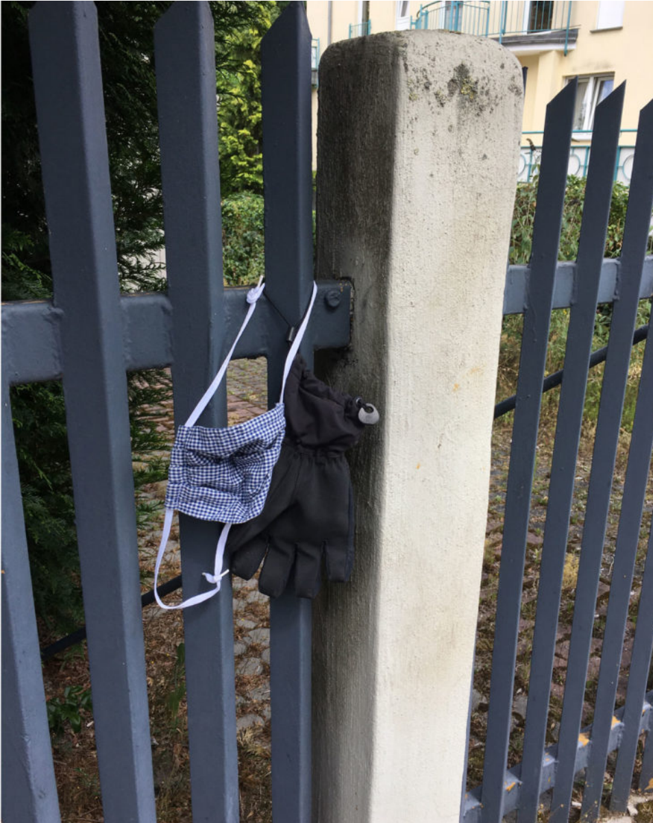
6. Juli 2020 | Leipzig | Lost & Found