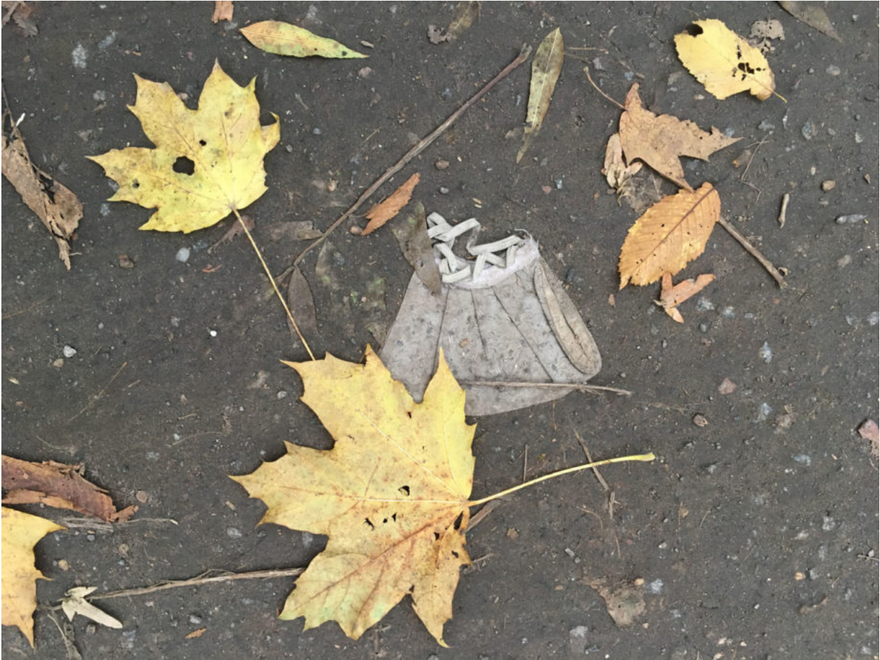
25. Oktober 2020 | Leipzig | Lost & Found