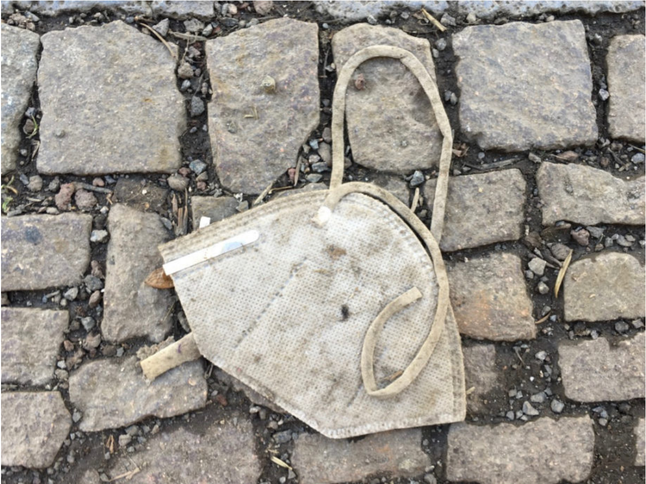
22. Februar 2021 | Leipzig | Lost & Found