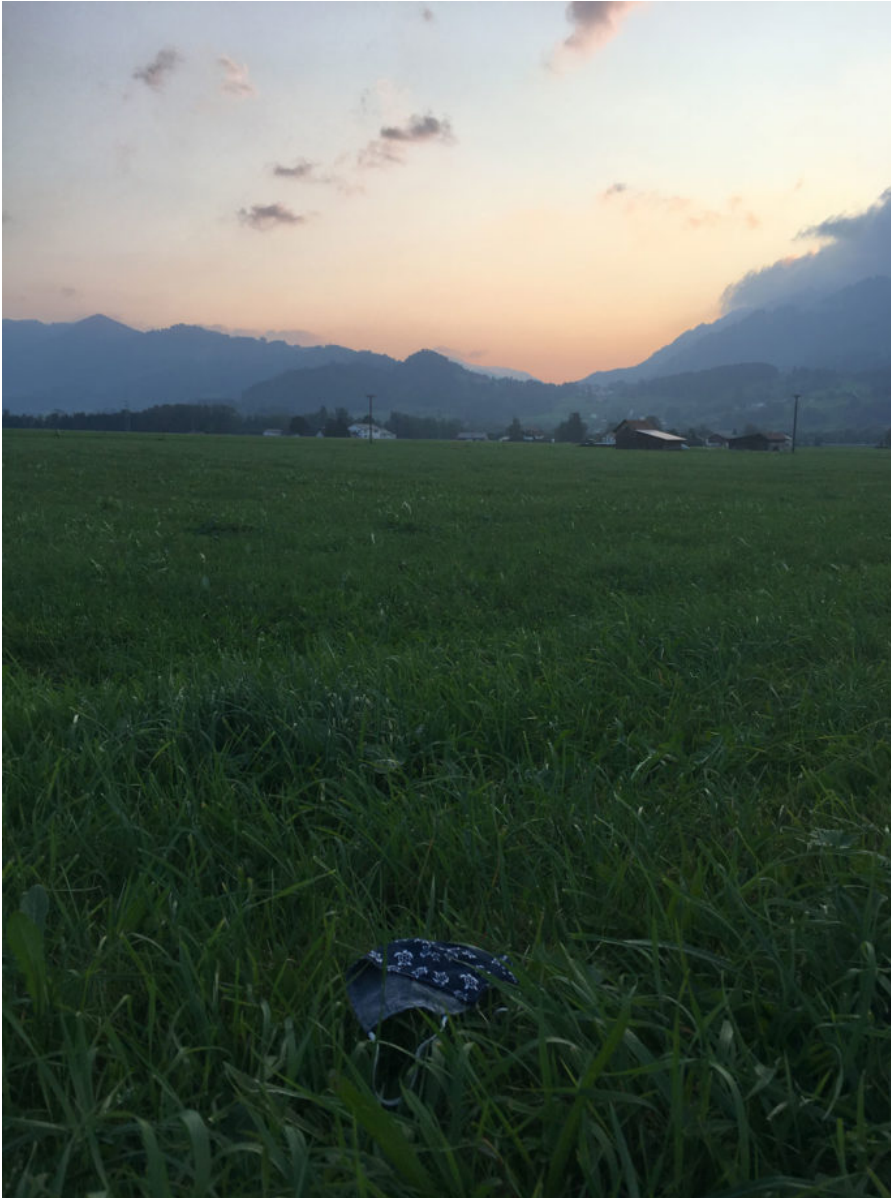
17. September 2020 | Burgberg im Allgäu | Lost & Found