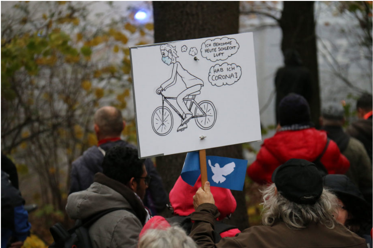
18. November 2020 | Berlin | Schlechte Luft