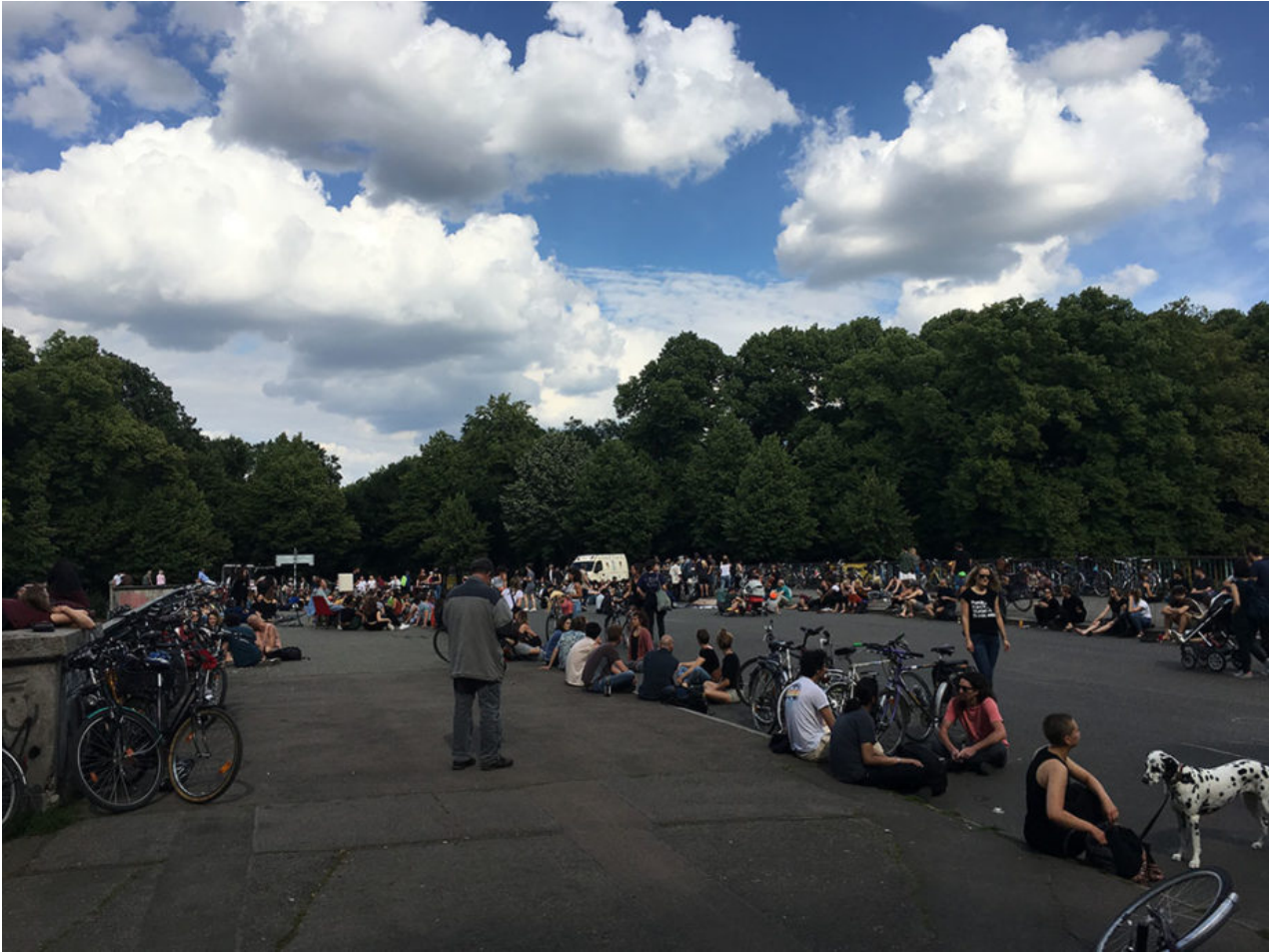
20. Juni 2020 | Leipzig | Fun, Fun, Fun