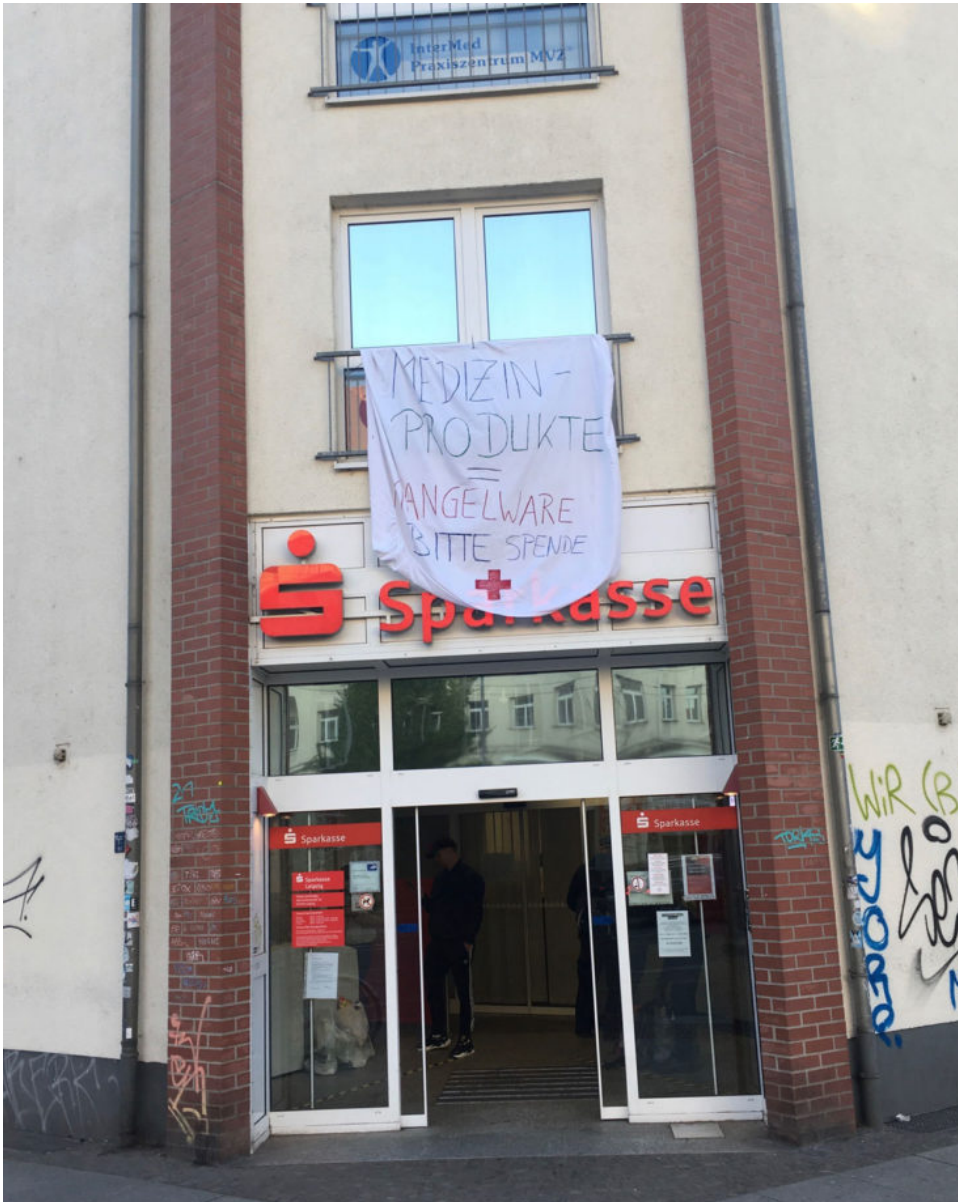
24. März 2020 | Leipzig | Image of Limited Good