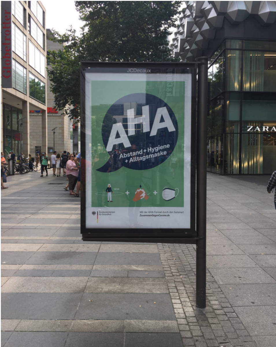
14. August 2020 | Dresden | AHA