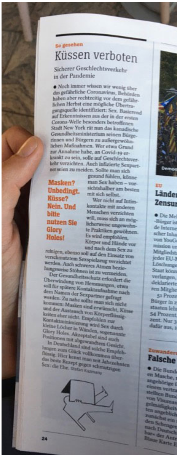
15. September 2020 | Der Spiegel | Sex, Sex, Sex