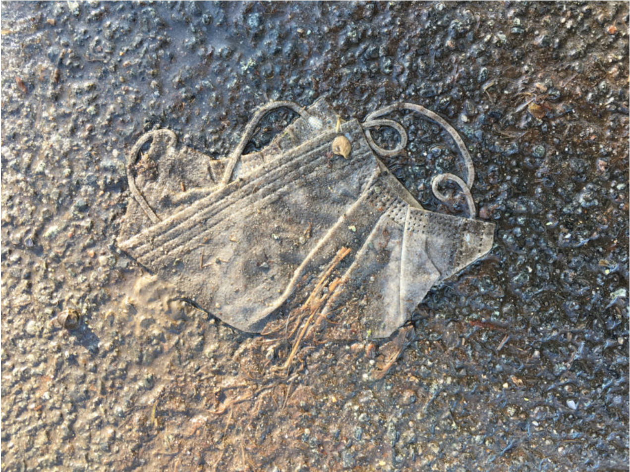
21. Februar 2021 | Leipzig | Lost & Found