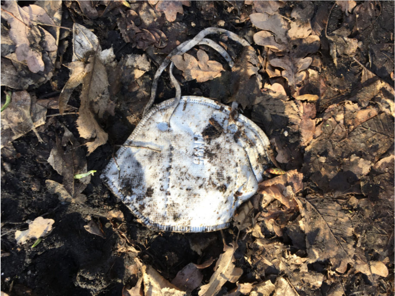
21. Februar 2021 | Leipzig | Lost & Found