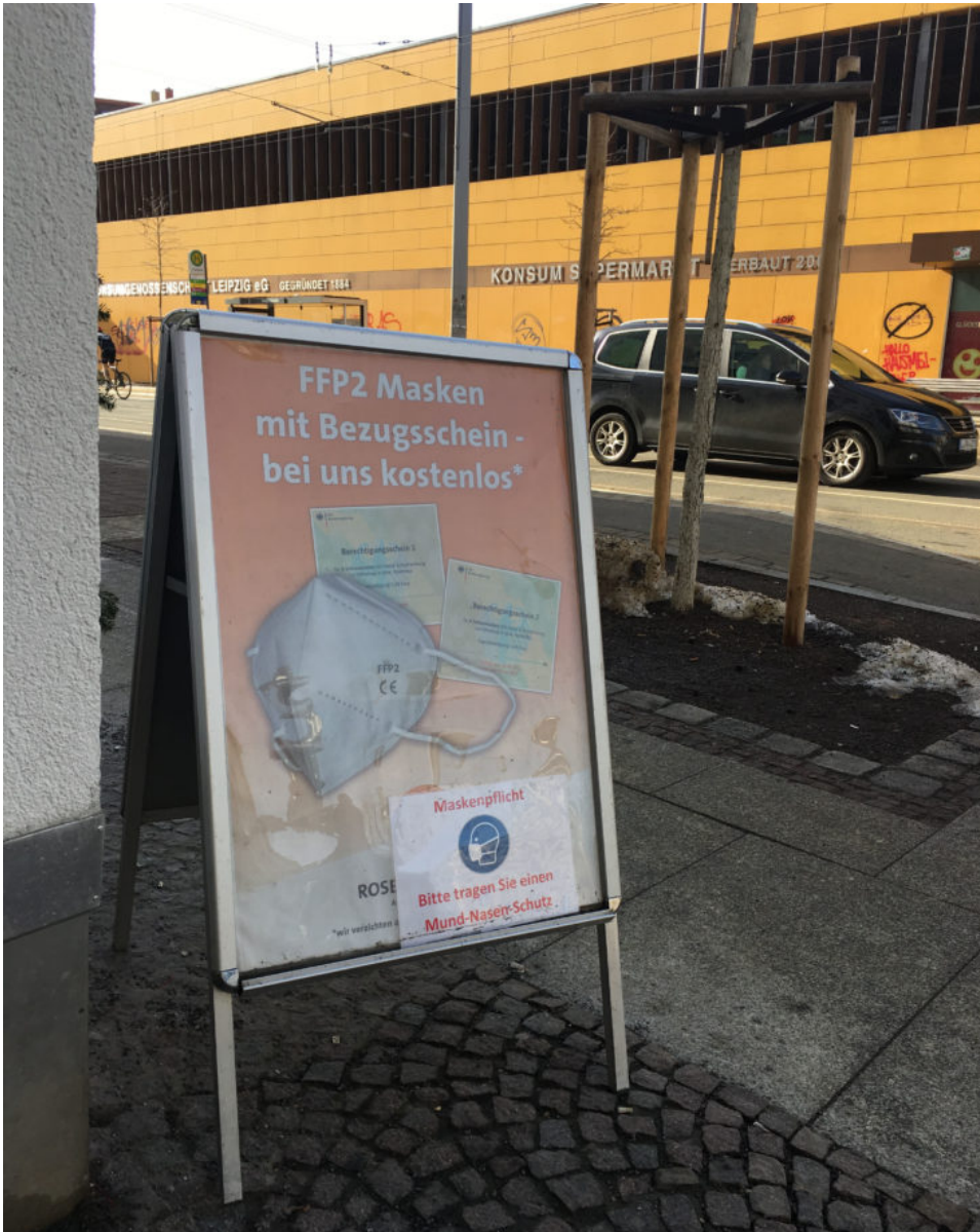
20. Februar 2021 | Leipzig | Kosten los