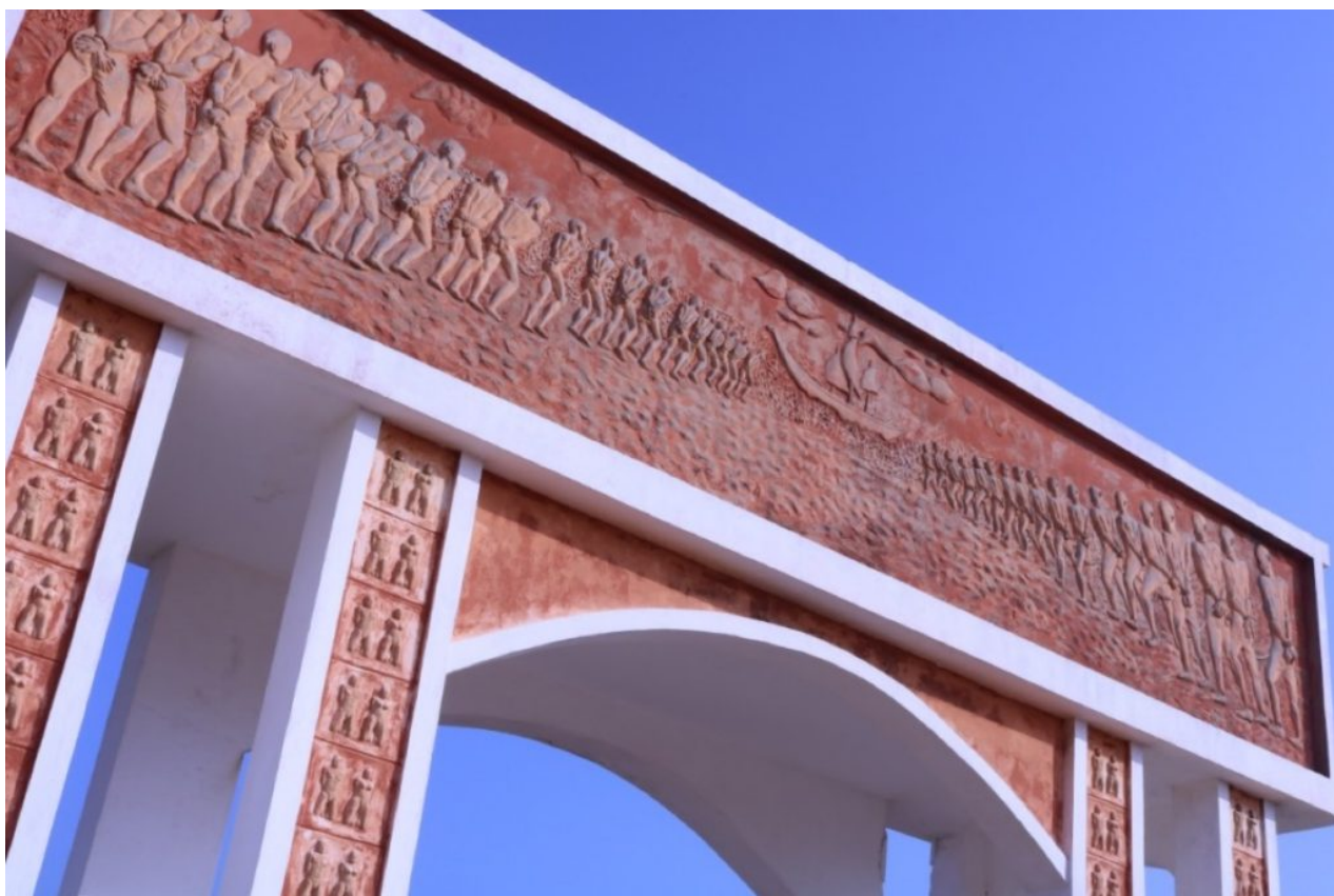
„Porte du Non Retour“, Ouidah, Bénin.